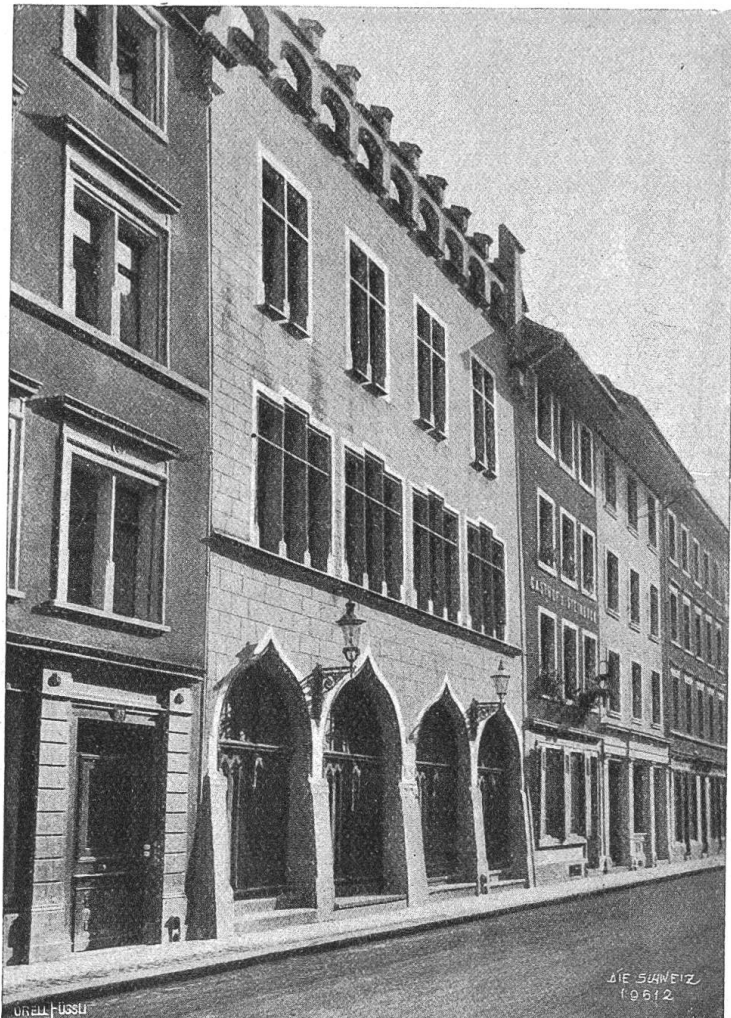
Die alte „Kunsthalle“ in Winterthur.

Ein besonderes Wort endlich verdient auch die Illustration dieses zweiten Bandes, die derselbe kluge Sinn gewählt hat, der über dem ersten Buche waltete. Es sind alles Bilder von dokumentarischem Wert, Porträte, die den Text ergänzen,