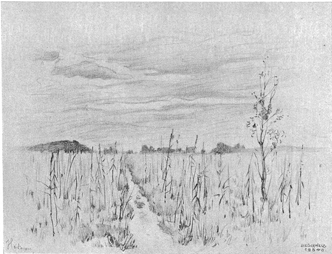
Jeannette Gauchat (1871—1915).