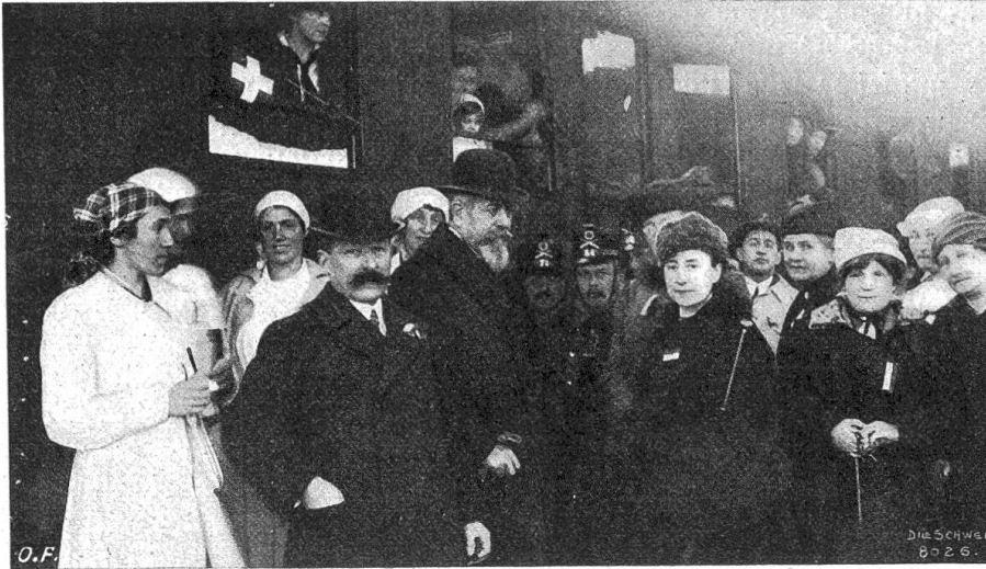
Durchreise franz. Evakuiertes durch die Schweiz (in der Mitte der franz. Botschafter Beau im Kreise der Zürcher Komiteemitglieder).

der Zentralmächte versucht, diesen Punkt als möglichst bedeutungslos hinzustellen; Erzerum soll gar keine Festung mehr gewesen sein und nur noch eine ganz veraltete Ausrüstung besessen haben. Dem widerspricht aber die Tatsache, daß noch bis vor kurzem in Erzerum ein deutscher Kommandant den Befehl führte, der sich aber dann in Konstantinopel unmöglich machte, weil er sich an den von dort aus angeordneten Armeniermordeleien nicht beteiligen wollte, was zur Ehre des deutschen Namens hier ausdrücklich festgestellt sei. Der neue türkische Kommandant erwies sich als unfähig, dem russischen Ansturm zu widerstehen, und räumte nach heftigen Kämpfen den Platz.