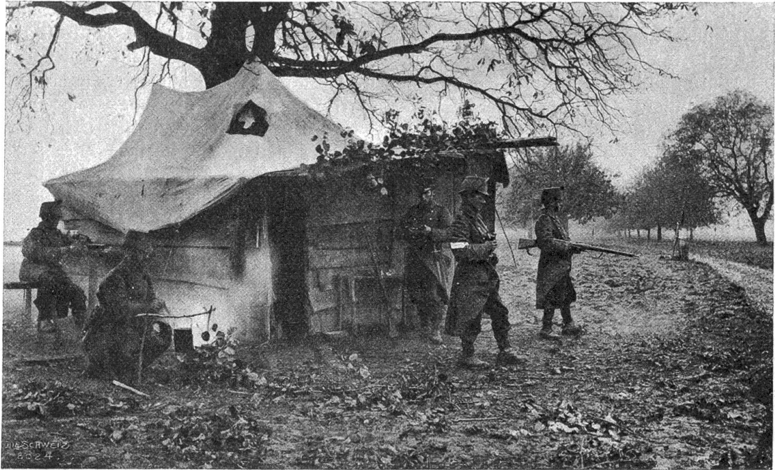
Schweizerische Grenzschutz.