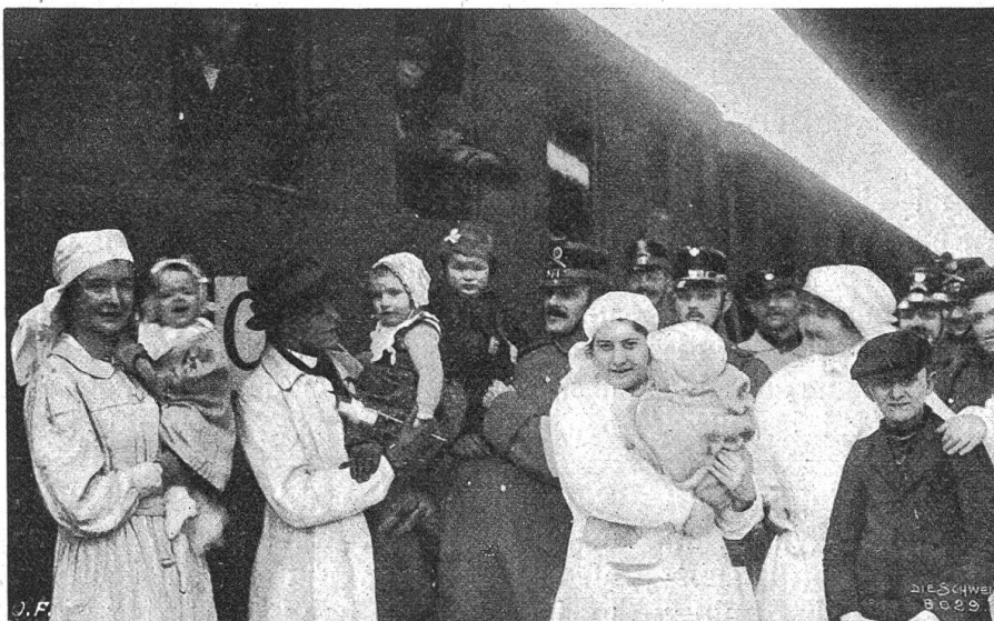
Durchreise franz. Evakuiertes durch die Schweiz (Kinder nach der Bekleidung).

Von andern Gründen abgesehen, wird man vielleicht schon deshalb in der deutschen Heeresleitung das Bedürfnis gehabt haben, durch eine neue kräftige Aktion im Westen den Eindruck der Nachrichten aus Kleinasien abzuschwächen und namentlich den Franzosen zu zeigen, daß sie sich vergebliche Hoffnungen