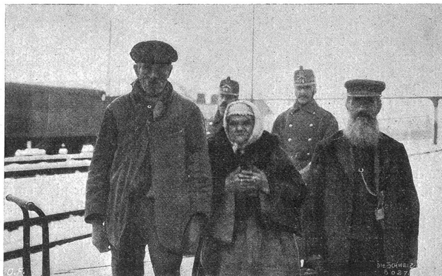
Durchreise franz. Evakuiertes durch die Schweiz (Bauern aus den Argonnen).

Parallel mit der Offensive gegen Verdun ging eine solche im Oberelsaß in der Richtung auf die Festung Belfort. Der Lärm von diesen artilleristischen Angriffen schallte mit einer bisher nie gehörten Stärke nach Basel und in die dahinter liegenden schweizerischen Gebiete hinein. Daß auch im Elsaß größere Dinge sich vor-