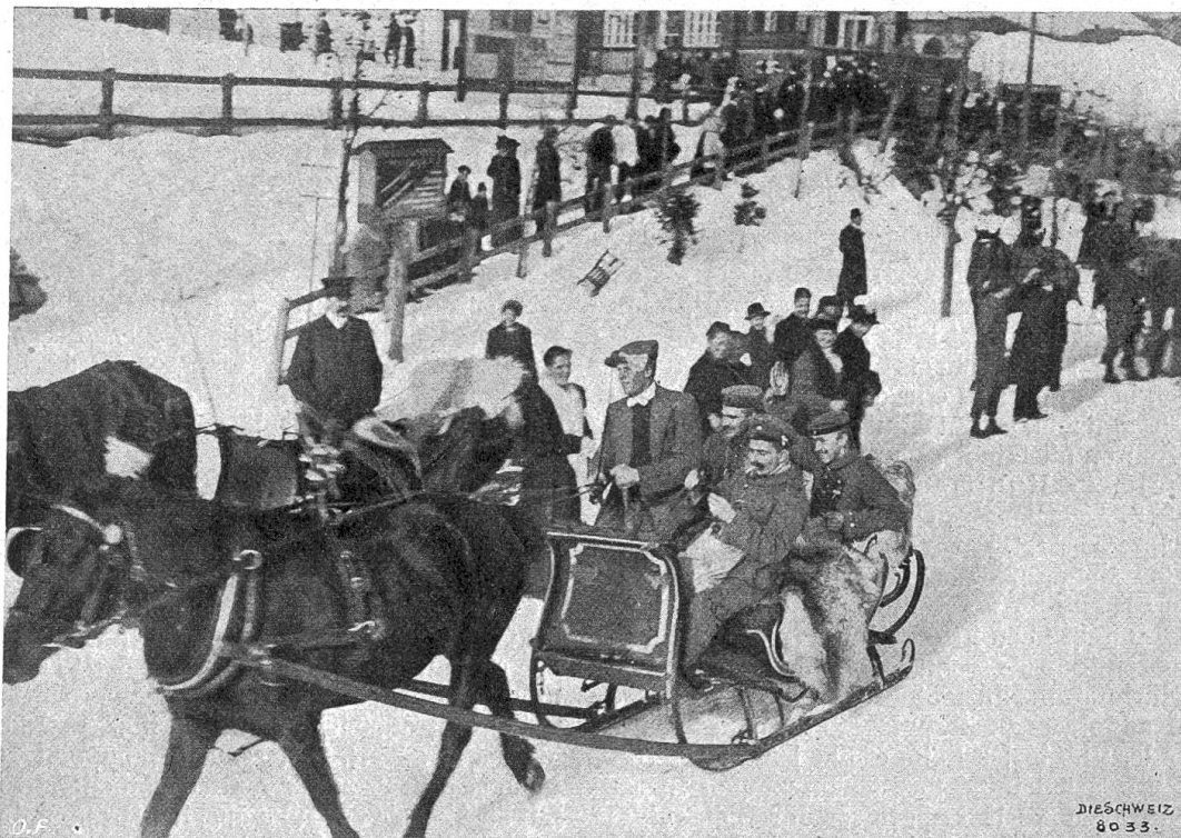
Ankunft kranker deutscher Kriegsgefangener in Davos.