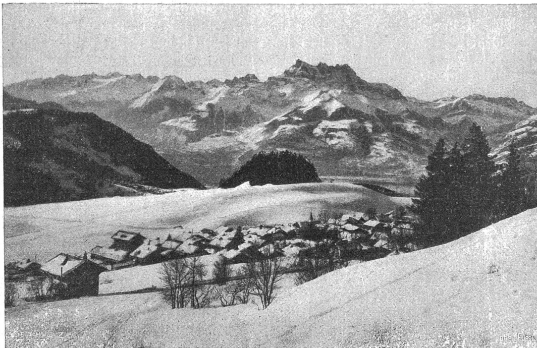
Leysin im Winter, Station kranker französischer Kriegsgefangener in der Schweiz.