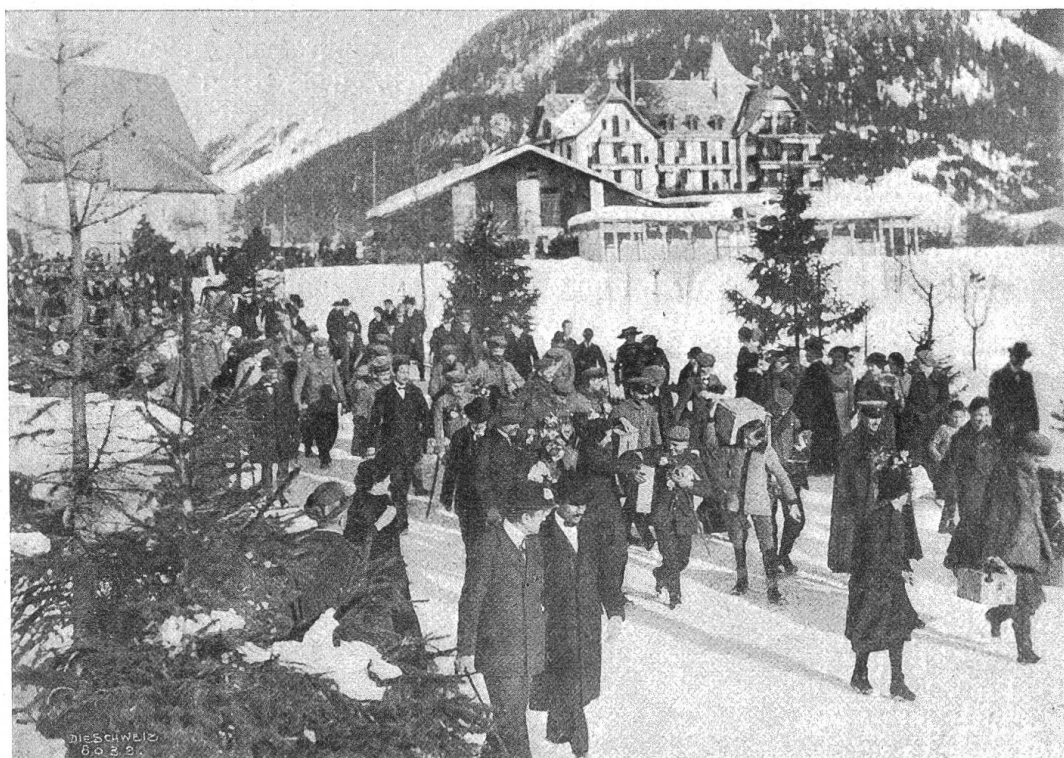
Ankunft kranker deutscher Kriegsgefangener in Davos.

hier, bis die Stunde der Erlösung für sie schlägt. Was mag in ihrem Herzen vorgehen, liegt die Grenze des Feindes endlich hinter ihnen, sehen sie mitfühlende Augen und helfende Hände? Tränen der Bewegung sind viele geflossen, nicht nur von denen, die zu uns, abgehärmt und verbittert, zum Teil sogar nur notdürftig bekleidet, kamen. Seht her, das ist der Krieg! schrie es aus ihrer Schar heraus, aus ihren müden Augen, ihren kranken Gliedern, ihrem bebenden Mund. Sonne und neues Leben brachten wir ihnen, und wenn es auch nur wenige Stunden waren, die sie auf neutralem Boden verweilten, manches Verzweifeln an der Menschheit, mancher tiefwurzelnde Haß, mancher bittere Gedanken verlor an Schärfe, und schönere Gedanken und Gefühle huschten durch die Reihen und schlugen ein Stückchen Brücke zu neuem Lebensmut. Ihre Händedrucke, ihre Dankesworte, ihre Tränen und ihre Hochrufe auf unser Land kamen aus übervollem Herzen, und manches der Schweizerfährnchen, mit denen wir die Ankommenden beschenkten, wird noch nach Jahren da und dort in der Heimat der Heimkehrenden zu finden sein und die Erinnerung an ein paar sonnige