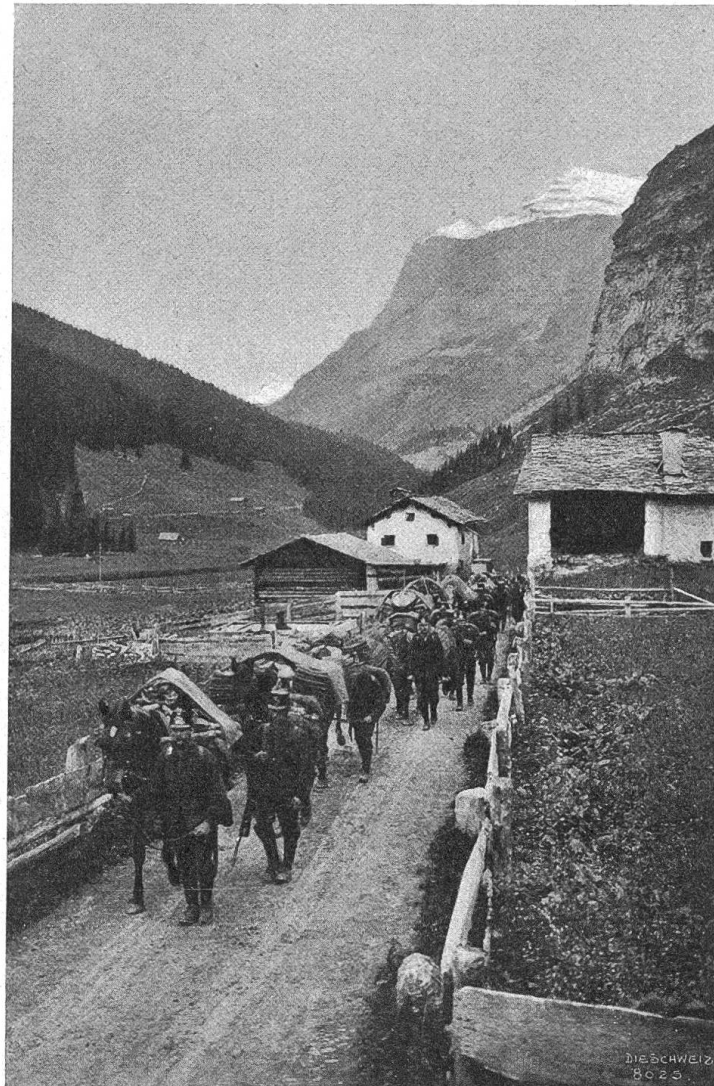
Trainsolonne auf dem Marsch.

Generalstabschef sein mochte, wurde genau wie der andere behandelt und verhört; es gab keine ungleiche Elle nach unten und nach oben, kein „taktvolles“ vorsichtiges Umgehen „verfänglicher“ Fragen gegenüber dem hochangesehenen Oberstkörpskommandanten und Chef des Generalstabs; auch er mußte Rede und Antwort stehen über die in unserm Generalstabsbureau herrschende Auffassung von Neutralität, aus der heraus die Handlungen der Angeklagten zu erklären waren. Das Gericht hat in seiner Urteilsbegründung jene Auffassung mit dem entschiedensten Nachdruck abgelehnt. Diese