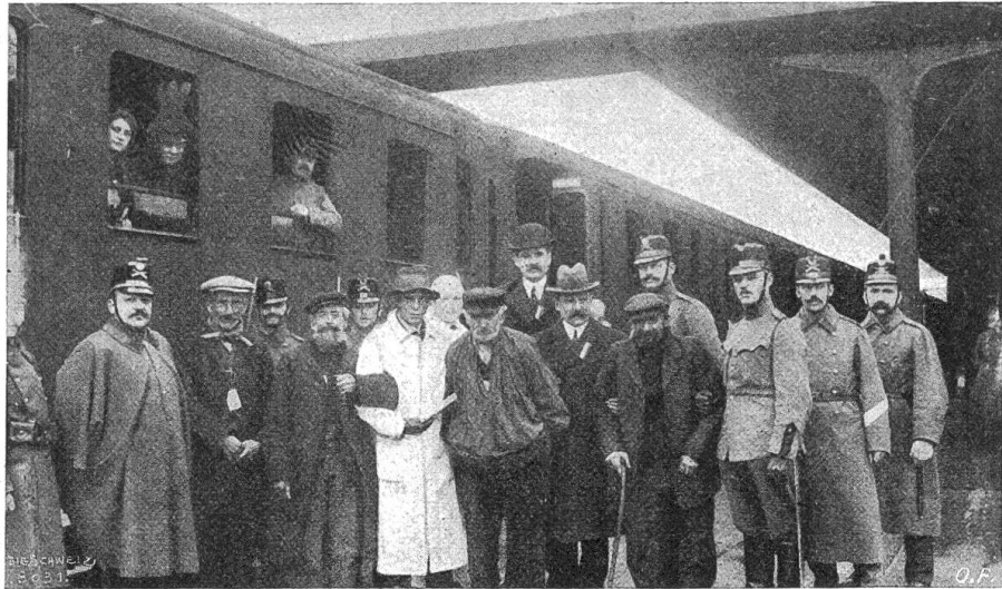
Durchreise franz. Evakuiertes durch die Schweiz (Gruppe 80jähriger Veteranen).

nach französischer Meldung ungeheuerlich sein sollen. Am 25. Februar wurde von den Deutschen das Fort Douaumont erstürmt und seither trotz immer wiederholten Gegenangriffen der Franzosen festgehalten. Douaumont ist der nordöstliche Eckpfeiler der