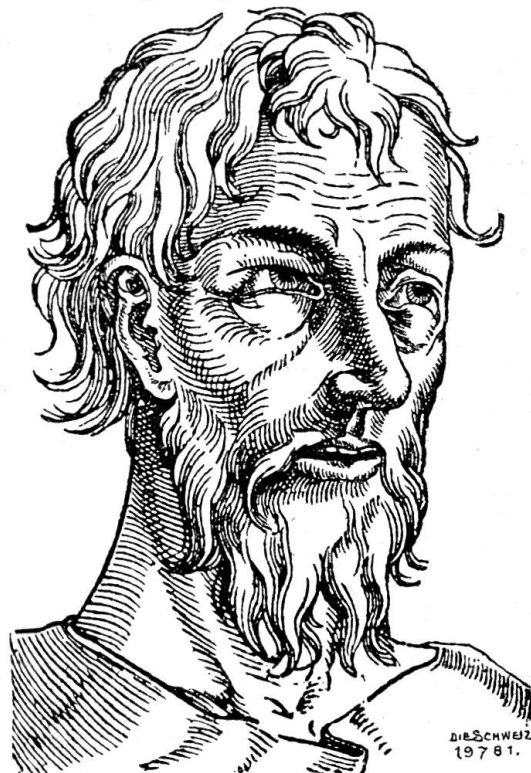
Nikolaus von der Flüe.

D ies ist Nicolaus / der in dem Wald/ Untruncken und Ungessen/ Allein bey zwanzig Jahren bald Einsidlerisch geseßen. Die Berg und Felsen im Schweizerland/ Die haben gehört sein Klagen!