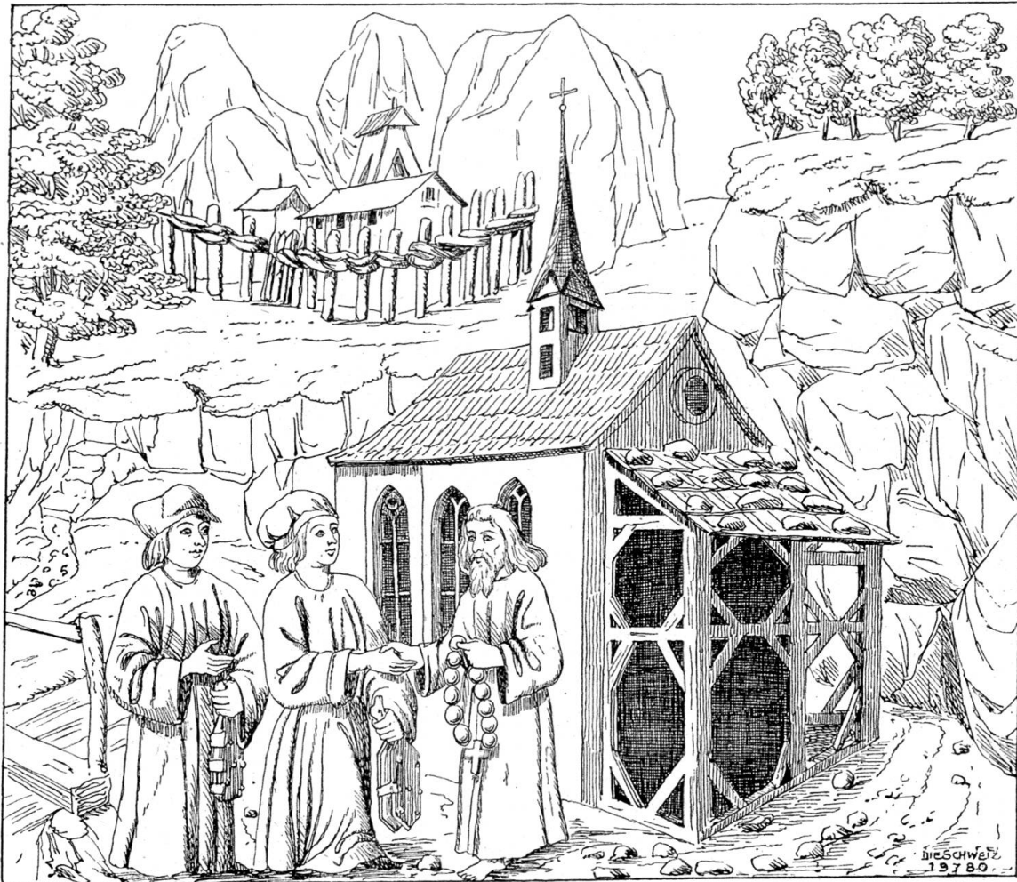
Pfarrer am Grund begibt sich zu Nikolaus von der Flüe im Ranft.

Zeitgenössische Darstellung aus der Schweizer-Chronik Diebold Schilling's des Luzerner's (ca. 1460- gegen 1520).