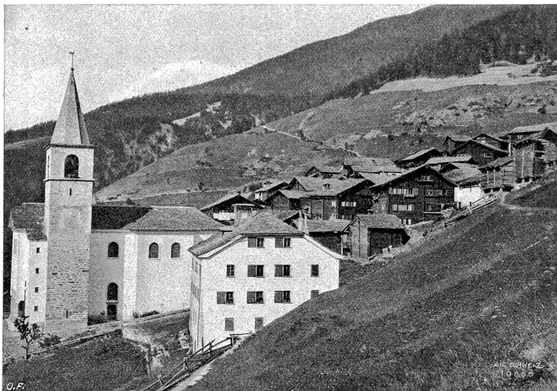
Das Heidenwasser Abb. 1. Visperterminen, das Herrenviertel mit Kirche und Pfarrhaus.