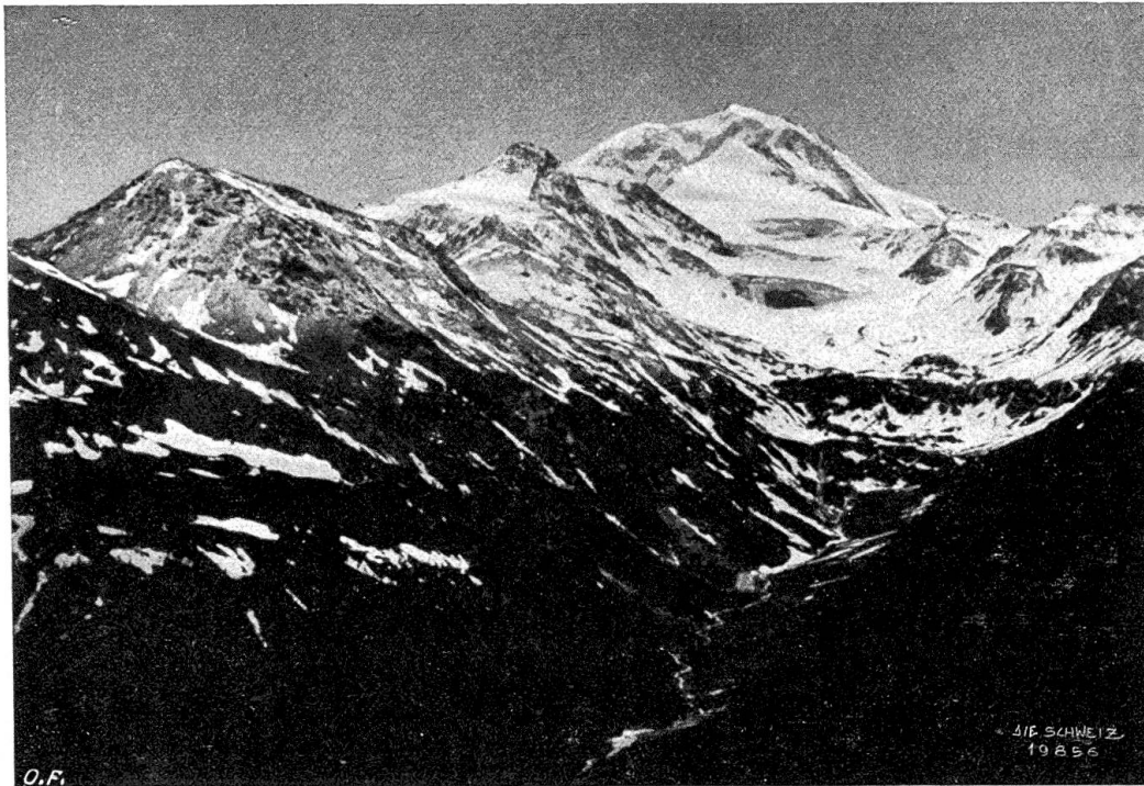
Das Heidenwasser Abb. 2. Das Nanz- oder Gamsertal mit der Gamsa; im Hintergrund der vom Gletschhorn (4001 m) herunterkommende Gamsergletscher, r. Simelhorn, l. Sirwoltenpaß.

etwa 1200 Meter ausdehnt. Es ist zugleich das am höchsten hinaufreichende Rebgebiet der Schweiz. Neben den bekannten Walliserorten wächst hier der berühmte Heidenwein, von dem man sagt, daß er beim Genusse allmählich ungemain gescheit, glücklich, reich, stark und schön mache, aber schließlich eine bedenkliche Knieschwäche verursache.