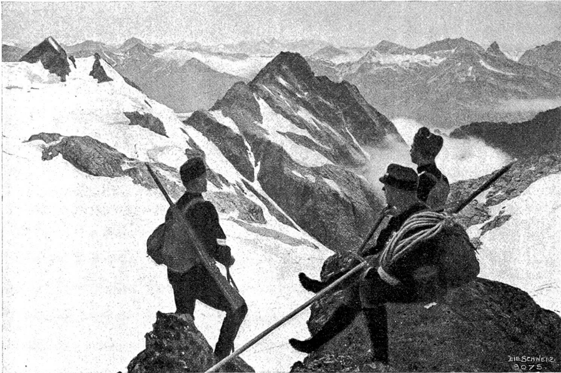
Schweiz. Grenzbesetzung. Blick auf den Surettagletscher nach dem Rheinwald und Tödigebiet.

rats kann nicht zu seinen Ungunsten ins Gewicht fallen, wenn man sich dessen bewußt bleibt, daß Geistesfrische und Tem-