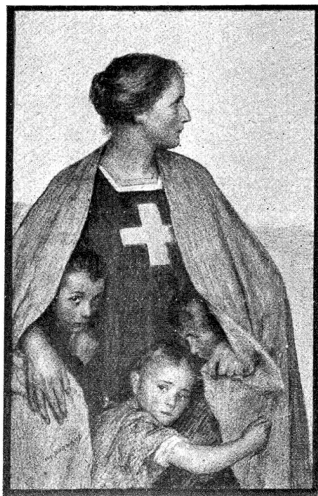
Eugène Burnand, Bressonnaz. Mutter Helvetia.

Während früher noch insbesondere der nordische und italienische Marmor