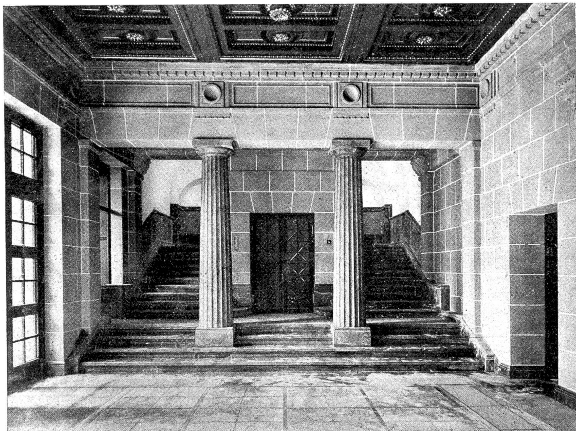
Parterre-Vorhalle im „Münzhof“ zu Zürich mit Säulen aus Granit von Andeer und Treppen aus Collombey-Marmor.

auch bei uns oft mit Erfolg mit den schweizerischen Arten in Wettbewerb trat, hat sich dies seit Eintritt der Transportschwierigkeiten geändert. Wir sind jetzt herzlich froh über unsere einheimischen Gesteine und sehen, daß man auch ohne die ausländischen Produkte auskommen kann. So ist z. B. in neuester Zeit das neue Bankgebäude der Schweizerischen Bankgesellschaft „Zum Münzhof“ in Zürich mit ganz geringen Ausnahmen nur aus Steinen schweizerischen Ursprungs errichtet worden, und unsere Marmorarten haben im Innern eine weitgehende Verwendung gefunden. In der Schalterhalle und im Vestibül des Parterre sind es lediglich solche Gesteine, die dem Raume das charakteristische Gepräge geben. Im Schalterraum bekleiden verschiedene Arten Walliser- und Tessiner-Marmor Pfeiler, Sockel und Fußboden, während im Vestibül vor allem die Säulen aus Granit von Andeer, zusammen mit der dunkeln Doppeltreppe aus Collombey-Marmor, dem Raum seinen ruhigen Ausdruck verleihen. Noch näher auf dieses Gebäude einzutreten, würde heute zuviel Raum in Anspruch nehmen, doch hoffen wir, unsern Lesern in einer nächsten Nummer noch einige Ausführungen bringen zu können.