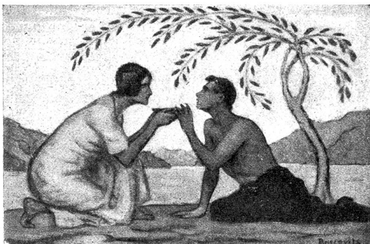
Friß Boscovits, Zollikon. Mildtätigkeit.

sches Institut Zürich) illustriert die Mildtätigkeit. Die Karten entsprechen somit nach ihrem Inhalt den Zeitumständen, und die Namen der Künstler bürgen für künstlerische Auffassung. Durch Beschluß des Schweiz. Bundesrates ist bestimmt, daß der Betrag dem Schweizerischen Roten Kreuz zugewandt werde, dessen Leitung unlängst ein Bittgesuch um Hilfe durch die Presse verbreitet hat. Nach Verständigung des Bundesfeierkomitees mit der Rotkreuz-Leitung sollen die Erträgnisse der Bundesfeierkarten hauptsächlich verwendet werden zur Anschaffung von Leibwäsche für bedürftige Soldaten der schweizerischen Armee. An dem Verkaufe der Karten, der am 21. Juli beginnt, beteiligen sich neben den Poststellen die Sektionen des eidg. Turnvereins, die Rotkreuzsektionen und die Samaritervereine. Die beiden Kartensüjets von Burnand und von Cardinaux gelangen auch als Gedenkblätter im Buchhandel zum Verkauf; sie eignen sich recht gut als Wandschmuck. Möchten die diesjährigen Bundesfeiergaben, die einem guten, vaterländischen Werke dienen, in dieser bedrängten Zeit recht starke Verbreitung finden, auf daß sie kräftig mitwirken zum