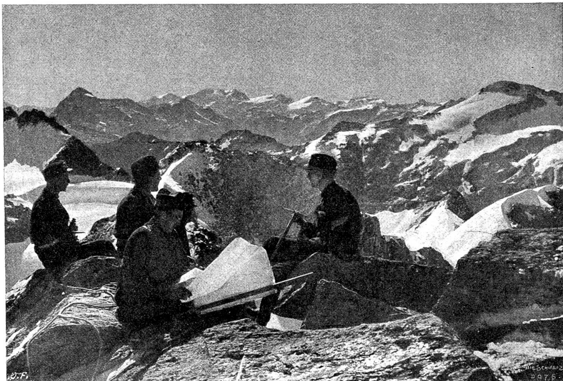
Schweiz. Grenzbesetzung. Offizierspatrouille auf Piz Suretta; Blick gegen die Bernina-Gruppe.

in der herrschenden Partei wußte man, was die Glocke geschlagen, und stimmte der Kandidatur Adors einhellig zu. Und wer in der deutschen Schweiz stets päpstlicher als der Papst, stets deutscher als die Deutschen denkt, konnte dann in den Artikeln des preußischen Korrespondenten der preußischen „Frankfurter Zeitung“ sehen, daß es möglich ist, vom deutschen Standpunkt aus (geschweige denn vom schweizerischen!) vernünftig und anständig über die Wahl Adors zu schreiben und daß deutsche Sympathie durchaus nicht notwendig mit Flegelhaftigkeit gegen die welschen Eidgenossen verbunden zu sein braucht. Gustav Ador war der Mann der Stunde. Die ganze Schweiz, soweit sie politisch urteilsfähig ist, war froh, in dem hervorragenden Genfer Staatsmann und Parlamentarier einen Leiter unserer auswärtigen Politik zu erhalten, der nicht nur als besonderer Vertrauensmann der welschen Schweiz gelten kann, sondern auch das uneingeschränkte Vertrauen der deutschen Schweiz verdient und überdies als Präsident des internationalen Roten Kreuzes sich längst den Dank und die Anerkennung des kriegführenden Auslandes ohne Unterschied der Partei erworben hat. Das Geburtsjahr 1845 des neuen Bundes-