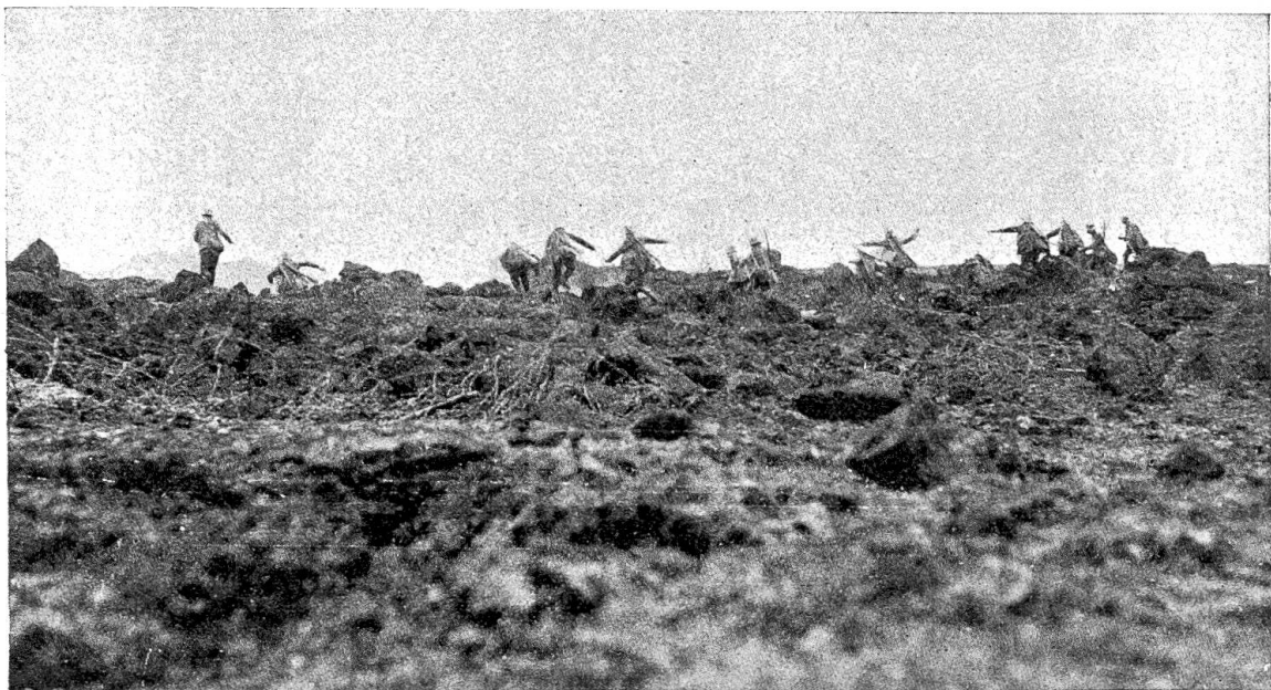
Besehen eines Minentrichters nach erfolgreicher Sprengung durch deutsche Sturmtruppen.