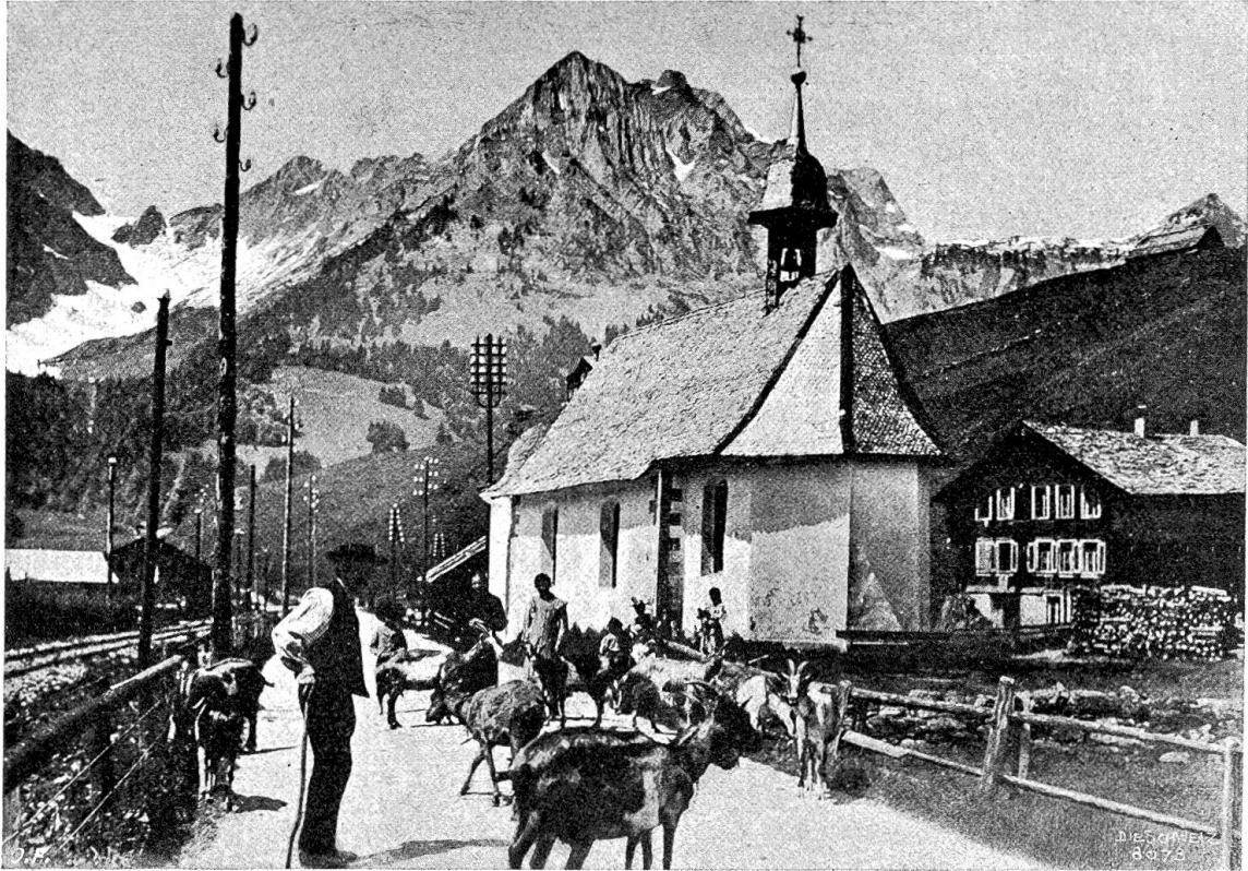
Grafenort an der Engelbergerbahn.