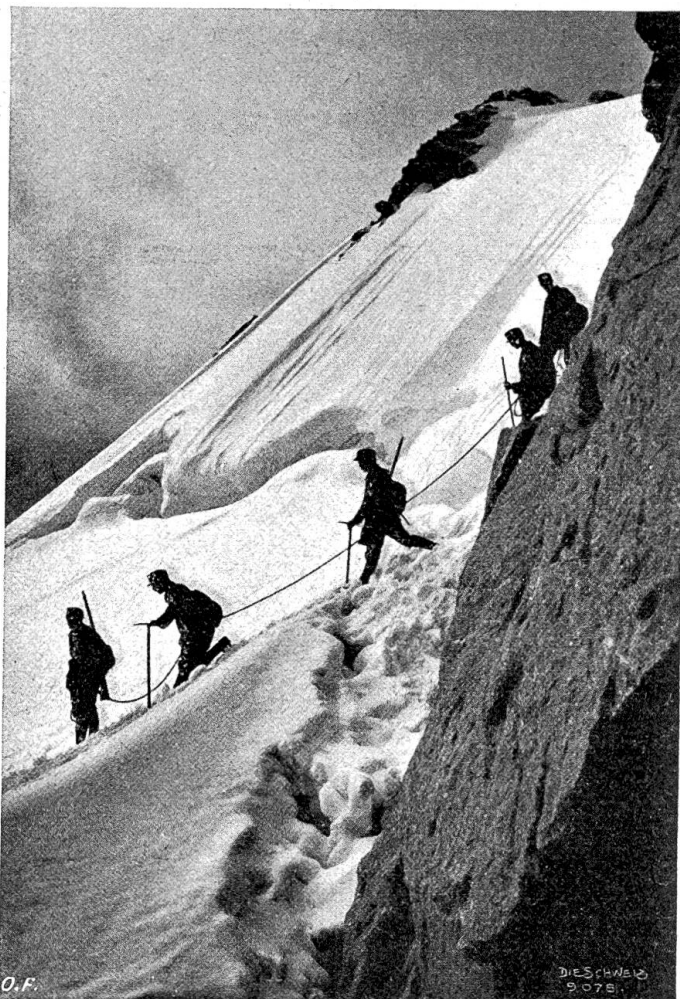
Schweiz. Militär im Gebirge. Patrouille im Abstieg vom Monte Rosa-Gletscher.

Das ist das Bild, das der Weltkrieg im Beginn seines vierten Jahres zeigt: Das Volk in Rußland — und anderwärts! —