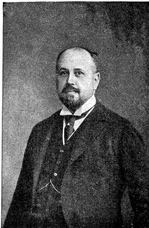
Minister Alphonse Dunant, der neue Botschafter der Schweiz in Paris.

besehten, so wird damit das Wesentlichste angedeutet sein, was der Juli 1917 brachte. S. Z.