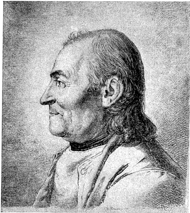
Jacob Guger (1716-1785) von Bernmatswil bei Ulster (St. Zürich), genannt „Kleinjogg“, der „philosophische Bauer“ (le Socrate rustique). Nach der Radierung (v. 1775) von Daniel Chodowiecki (1726-1801).