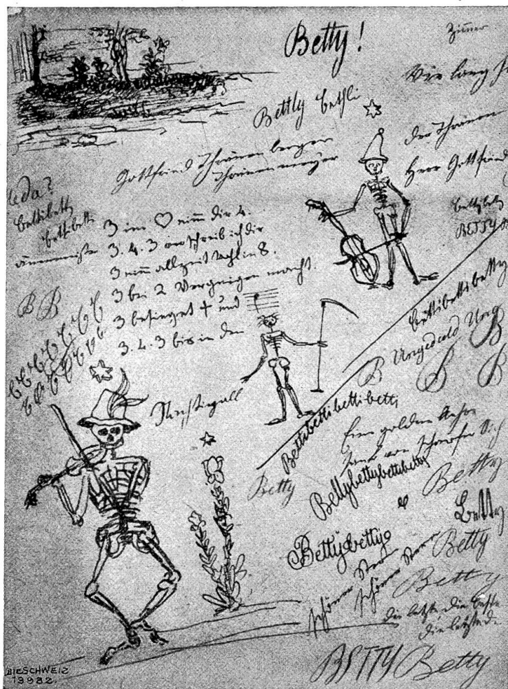
Zeichnerische Schnurrpfeifereien Gottfried Keller's 1892.