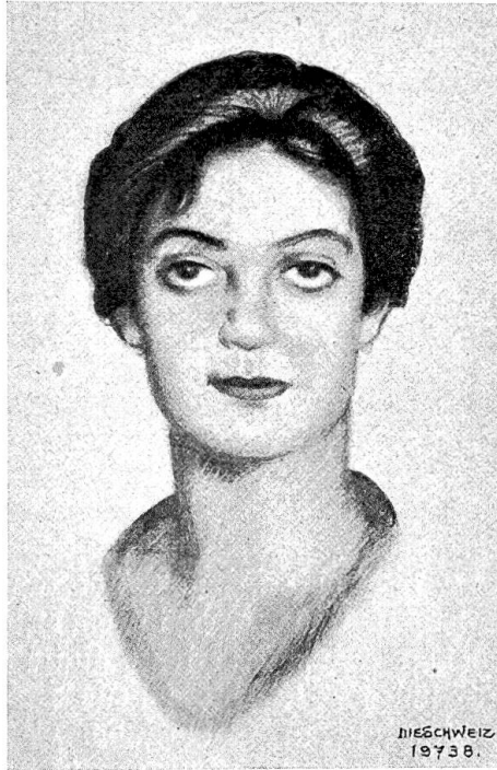
Aloys Huggenberger, Morges. Bildnis (Zeichnung, 1915).

der Igel, die allerliebste erzählt und illustriert ist und von der Liebe des Dichters zur Tierwelt be- redtes Zeugnis ablegt, wie auch die ganz reizende Geschichte vom alten, geplagten Karrengaul, der von den Zeiten träumt, da er die „Maifö- nin“ trug und die schöne Erzählung vom „Weg ins Leben“, den die jungen Füchselein antreten. Nicht nur Kinder werden an diesen feinen, be- sinnlichen Fabeln herzliche Freude haben. Aber auch der uns längst bekannte Huggenberger kommt zum Wort: der Schilderer und Darsteller des Bauernlebens und -wesens. Da nehmen wir Teil an einem „Markt- gang“, den der Dichter als Knabe einst an der Seite seines Vaters zurückgelegt hat, und werden bekannt mit allerhand lebendig ge- schauten Typen aus dem Stand der Landwirte und Händler, und als allerbeste dieser lebenswarmen Ge- schichten sei besonders die vom kreuzweisen Christ- baumdiebstahl hervorgeho- ben, die den Titel trägt: „Der Maispacher holt einen Christbaum“. Wer da nicht herzlich lacht, wenn er liest, wie die zwei Nach- barn mit ihren „gewilder- ten“ Christbäumen ein- trächtig heimwärts wan- dern, von guter Nachbar- schaft reden und wissen, daß ein jeder sein Bäum- chen im Wald des andern geholt, der hat keinen Sinn für echten, ge- sunden Humor! Wahrhaftig, so ist's, so wird's getrieben — und nicht nur das: so, genau so, wie's bei dem Maispacher dargestellt wird,