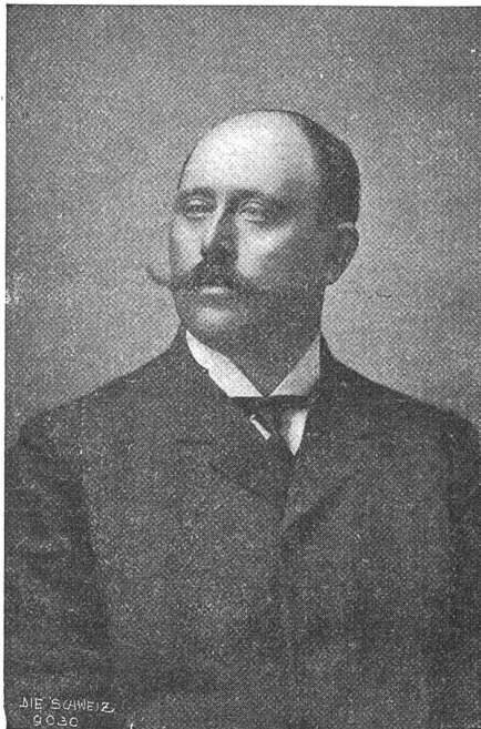
Dr. Philipp Mercier (von Glarus und Lausanne) Schweiz, Gesandter in Berlin.

zu stürzen, so wünschenswert es sei, daß Deutschland ein demokratischer Staat werde. Die vom Grafen Czernin in Brest-Litowsk proklamierten Friedensbedingungen könnten unmöglich als Grundlage für einen dauernden Frieden angesehen werden, da sie zweideutig seien. Rußland müsse sich selbst helfen, wenn es nicht seine Selbständigkeit verlieren wolle. Polen müsse in allen seinen Teilen und wirklich befreit werden und Oesterreich-Ungarn müsse seinen Nationalitäten eine volle Autonomie gewähren und die legitimen Ansprüche Italiens und Rumäniens befriedigen. Die Türkei solle auf ihr Ursprungsland beschränkt werden unter In-