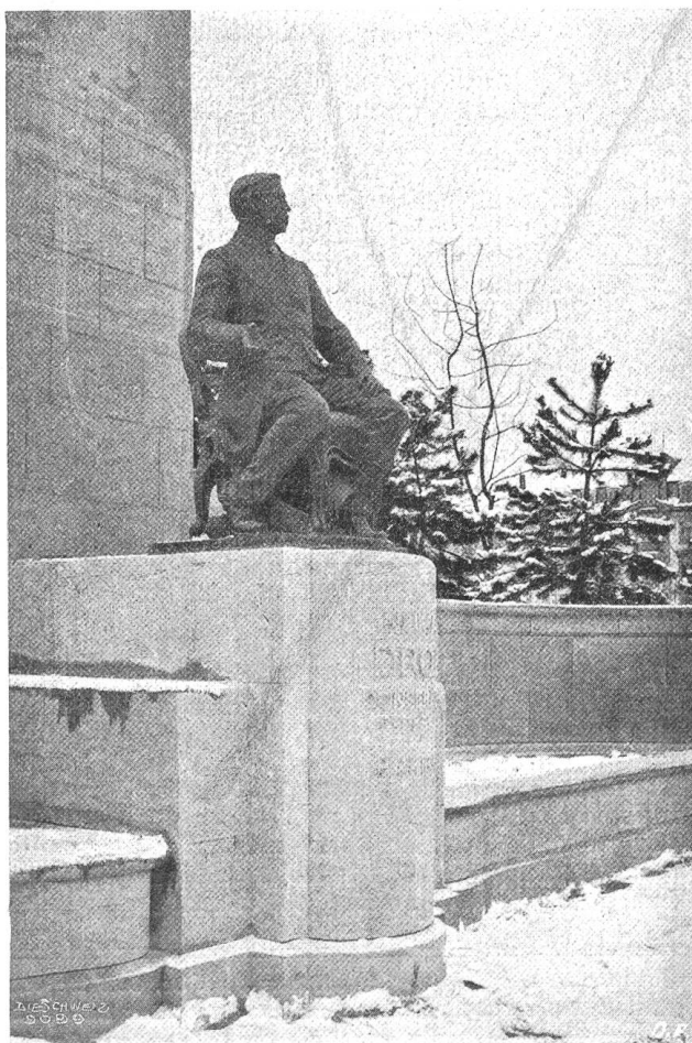
Suma Droz-Denkmal in La Chaux-de-Fonds.