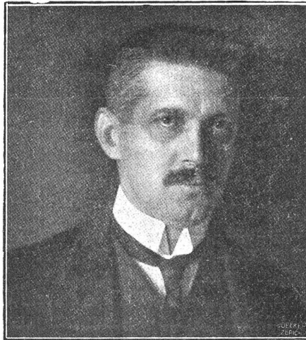
Bundesrat Dr. Robert Haab (von Wädenswil).

botene Gelegenheit wahrgenommen, um der großen Schwesterrepublik über dem Ozean den Dank der Schweiz für die ihr in so außerordentlich schwieriger Zeit gewährte Erleichterung und Unterstützung auszusprechen. Im gleichen Geist des Entgegenkommens war auch das an die amerikanische Uebereinkunft sich anschließende Abkommen mit Frankreich über denselben Gegenstand abgeschlossen worden. Mit Bezug auf die Kohlen sind wir nach wie vor vollständig auf Deutschland angewiesen, und auch dieses läßt es an gutem Willen keineswegs fehlen, uns das Nötigste zukommen zu lassen. Wenn trotzdem die Zufuhr der Kohlen mehr und mehr hinter den in den letzten Vereinbarungen getroffenen Quantitäten zurückbleibt und die Kohlennot bei uns immer höher steigt, so ist dies, wie Sachkundige versichern, hauptsächlich auf den Mangel an Rollmaterial zurückzuführen, und es hat sich deshalb der Bundesbahndirektor Zingg nach Berlin begeben, um zu versuchen, diesem Mangel durch weitere Verabredungen über eine zweckmäßigere Zirkulation des Rollmaterials abzuhelpfen. Genf hat inzwischen einen Versuch mit französischer Kohle gemacht, der befriedigend ausgefallen sein soll, und vom Volkswirtschaftsdepartement ist die Gründung