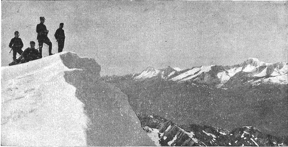
Offiziers-Patrouille im Gebirge.