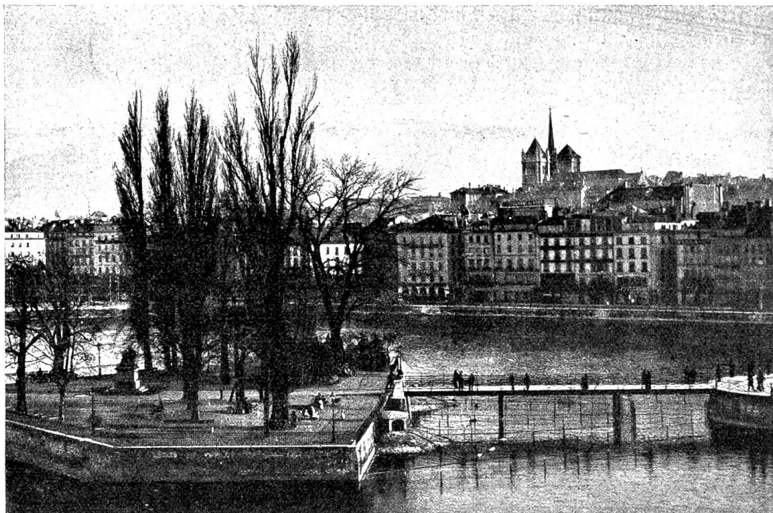
Die Stadt Genf, die zum künftigen Sitz des Völkerbundes erwählt worden ist.

Das noch ganz von imperialistischem Geist erfüllte italienische Volk nahm die Botschaft Wilsons sehr unwillig auf, und die Kammer erteilte den aus Paris zurückgekehrten Staatsmännern ausdrücklich ein Vertrauensvotum. Die Konferenz der Alliierten ließ sich indessen durch diese italienische Extratour nicht beirren, sondern setzte ohne Italien ihre Arbeit fort und lud am 12. Mai auch die österreichischen Delegierten zum Friedensschluß nach St. Germain-en-Laye ein. Dieser Umstand war es hauptsächlich, der dann die Italiener bewog, schleunigst nach Paris zurückzukehren, ohne vorher, wie sie ver-