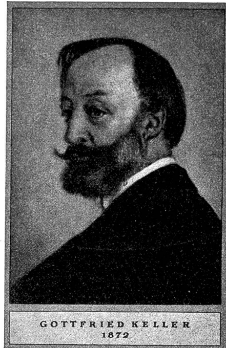
Sundesfeierkarten 1919 II. Gemälde von Frank Buchser.