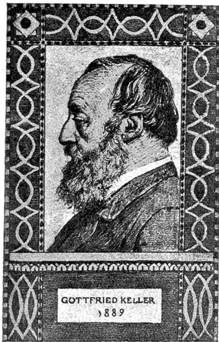
Sundesfeierkarten 1919 III. Nötelzeichnung von Arnold Böcklin.

Der Leser erfährt aus diesem schlichten Heftchen, daß Frank Buchsers, des Solothurner Malers (1828—1890) schönes Bildnis aus dem Jahre 1872 den Staatschreiber Keller auf der Höhe seines Lebens darstellt. Die Not- und Kummerjahre seiner Schul- und Malerzeit lagen hinter ihm; in der geräumigen Amtswohnung, die ihm angewiesen worden, hatte er seiner betagten Mutter noch ein paar Jahre sorgenloser Behaglichkeit als Entgelt für den vielen Kummer, den sie um ihn gelitten, bereiten können; als der Verfasser des „Grünen Heinrich“ und der Seldwylser Novellen hatte er sich bei den Kennern in der Schweiz und in Deutschland bereits einen Namen gemacht, und gerade im Jahre 1872 erschienen „Die sieben Legenden“, jene wunderbar bezaubernden kleinen Heiligengeschichten, deren Beurteilung durch drei deutsche Dichter aus Kellers Tagen wir an anderer Stelle dieses Heftes finden.