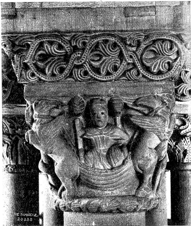
Vom Basler Münster Abb. 3. Himmelfahrt Alexanders des Großen. Säulenkapitell im Chorumgang (1. Hälfte des 13. Jh.'s).