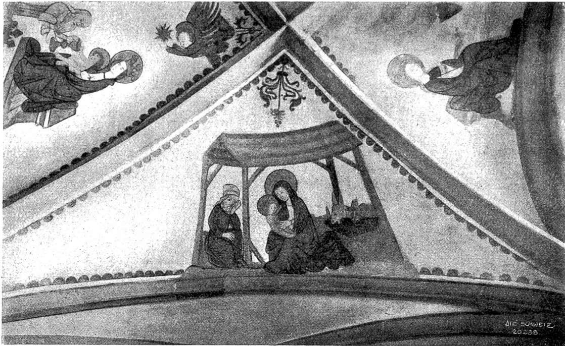
Dom Basler Münster Abb. 6. Geburt Christi zc. Fresken am östlichen (mittleren) Gewölbe der Krypta (Anfang des 15. Jh.'s).

erzählte Anselm von Canterbury in seinen Meditationen, wie Jesus am Kreuz die Arme ausbreite, um uns zu umfassen, wie er das Haupt neige, um uns zu küssen, und wie sein geöffnetes Herz seine ganze Liebe zu uns zeige. In der hl. Brigitte kommt Maria selber und erzählt ihr ihr Leiden mit furchtbaren Schilderungen der Qualen Christi. Die Hymnendichter und Prediger, die Mystikerdichter und Künstler versenkten sich in die Details der Passion; man zählt die Rutenstrieche Christi. Jede Stunde des Tages ruft ein Leiden in Erinnerung, man schwelgt in der Vorstellung der Qualen, aber man weiß auch die rührendsten Erzählungen vom Kreuzweg und von der Klage Mariä. Man dichtet Hymnen auf Lanze und Dornenkrone, die erst in gotischer Zeit dargestellt wird; Engel zeigen unter Trauern und Klagen die Passionsinstrumente; ja, es entsteht ein eigener Kultus der Wunden Christi. Gläubige sollen das Blut aus den Wunden