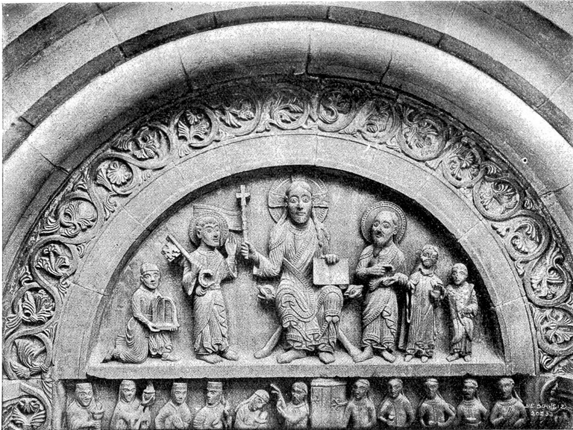
Vom Basler Münster Abb. 1. Tympanon der Gallusspforte (c. 1180). Oben: Christus thronend zwischen Petrus, Paulus und den Stiftern; unten: l. Christus und die klugen Jungfrauen (vgl. Abb. 2), r. die törichtigen Jungfrauen.