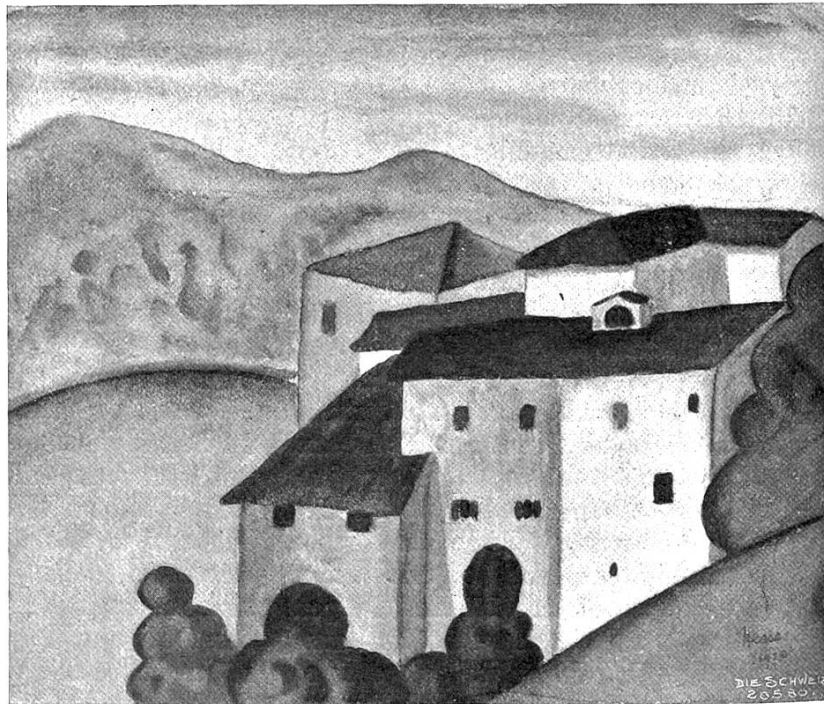
Hermann Hesse, Montagnola.

Nichts ist starr, nichts tot in solchem Erlebnis: die Bäume schaukeln sich, als ginge ein weicher mächtiger Wind durch die Nester und lege alle ihre Blätter auseinander. In der „Telephonstange“ drängt die schlankste Größe: sie schlängelt in die Höhe. Zwischen den Weidenbäumen taucht der „blaue Mann“ (S. 515) mit einer urhaften Plötzlichkeit auf, wie im Märchen, wenn es plötzlich heißt: Ein alter Mann oder ein Zwerg sei neben den Kindern gestanden; sie hätten nicht gewußt, woher er so schnell gekommen. Nur etwas fügt sich nicht ein in solches bewegliches Wachstum: die Fabriken, die Hesse bisweilen malt. Auch da spürt man es, wie