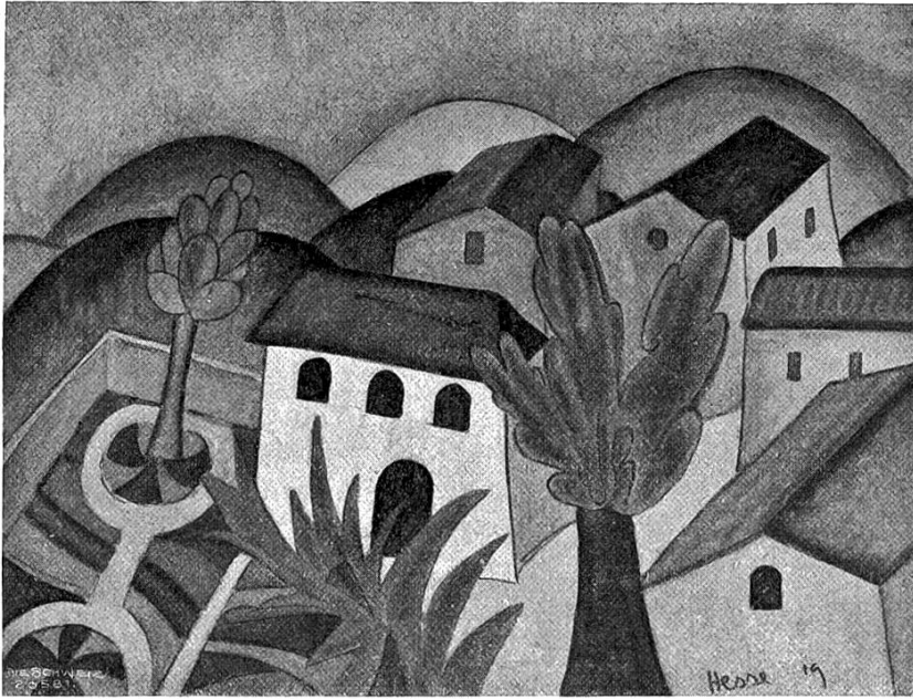
Hermann Hesse, Montagnola.

Häuser — ein neues Bild mit neuer Seligkeit, wie sich im Traum ein Bild an das andere drängt.