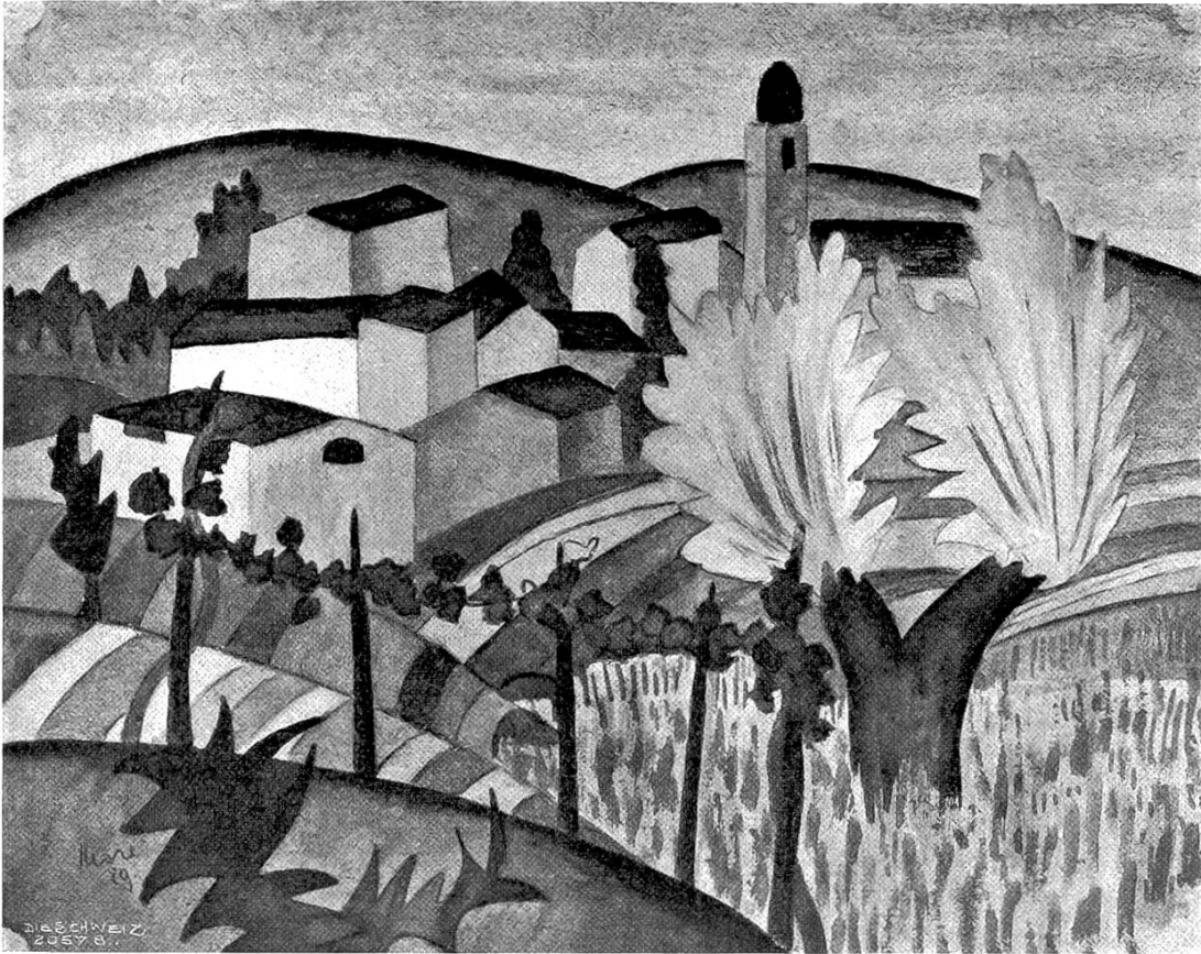
Hermann Hesse, Montagnola.