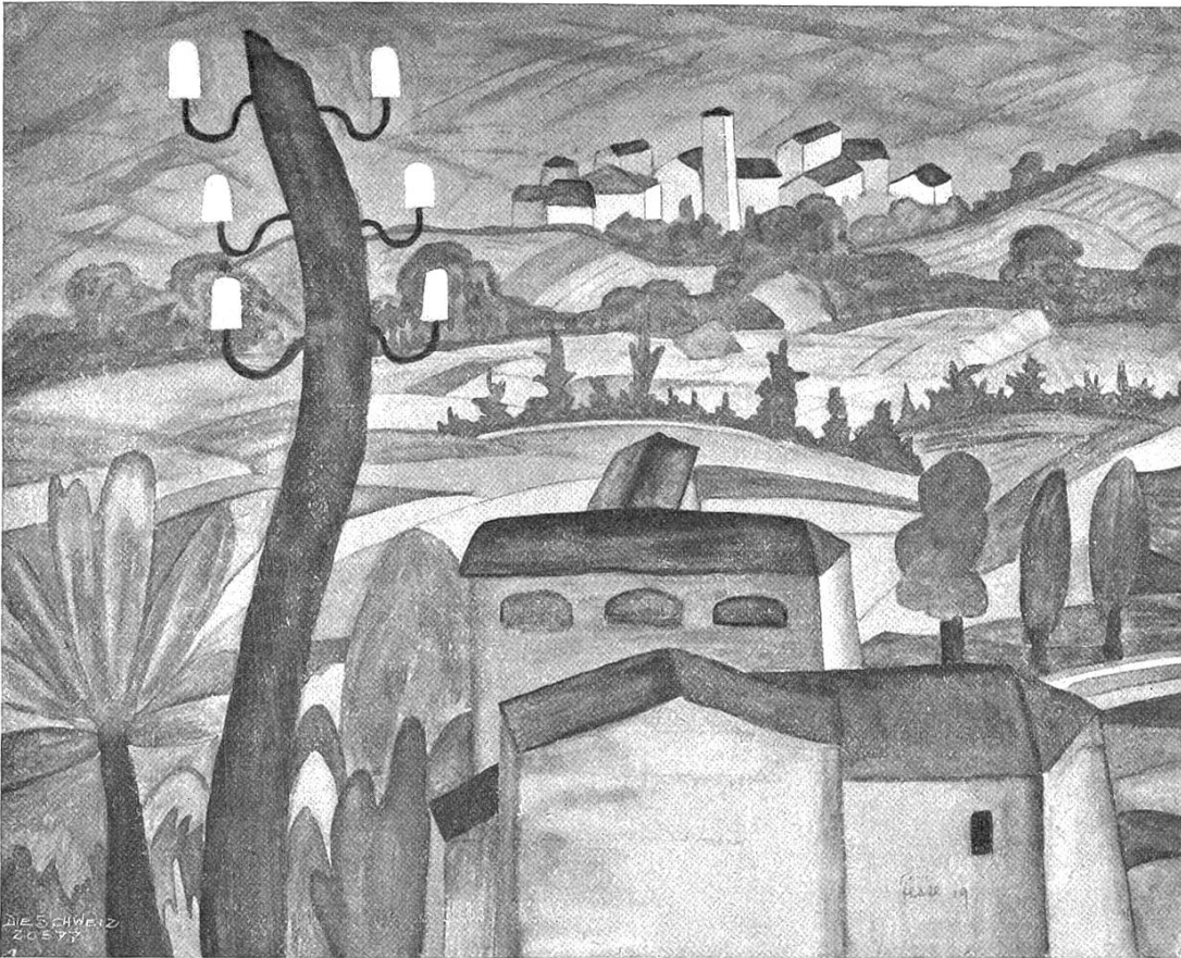
Hermann Hesse, Montagnola.