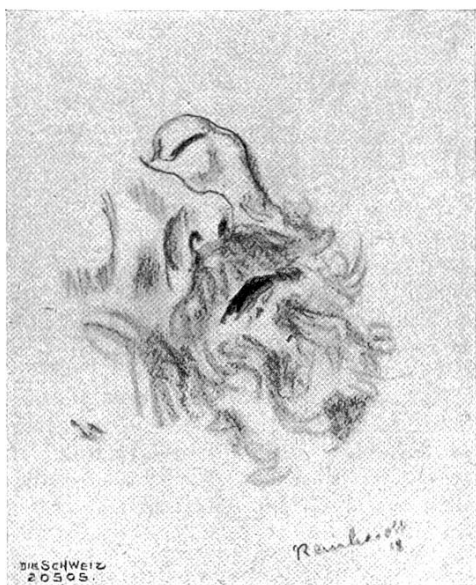
Alb. Reinhardt, Winterthur. Sterbender. Zeichnung.