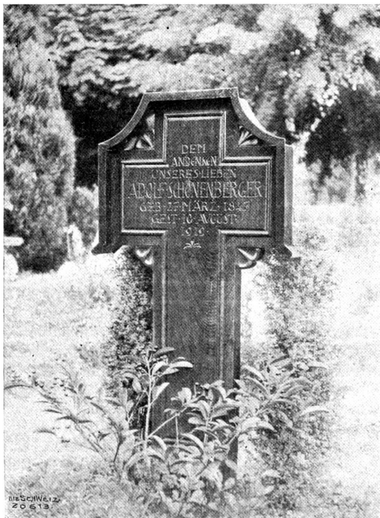
Grabmalakunst. Grabzeichen von Holzbildhauer C. Fischer, Zürich. Friedhof Rehalp, Zürich.