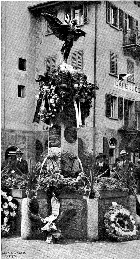
Zur Einweihung des Chavez-Denkmales in Brig (September 1920). Gestiftet vom Chavez-Komitee zur Erinnerung an den ersten Simplonflug des in Domodossola verunglückten Fliegers Geo Chavez (19. September 1910).

rat gesandt, das denselben in seiner Sitzung am 20. Oktober beschäftigte. Wir wissen jedoch noch nicht, welche Folge ihm gegeben werden soll.