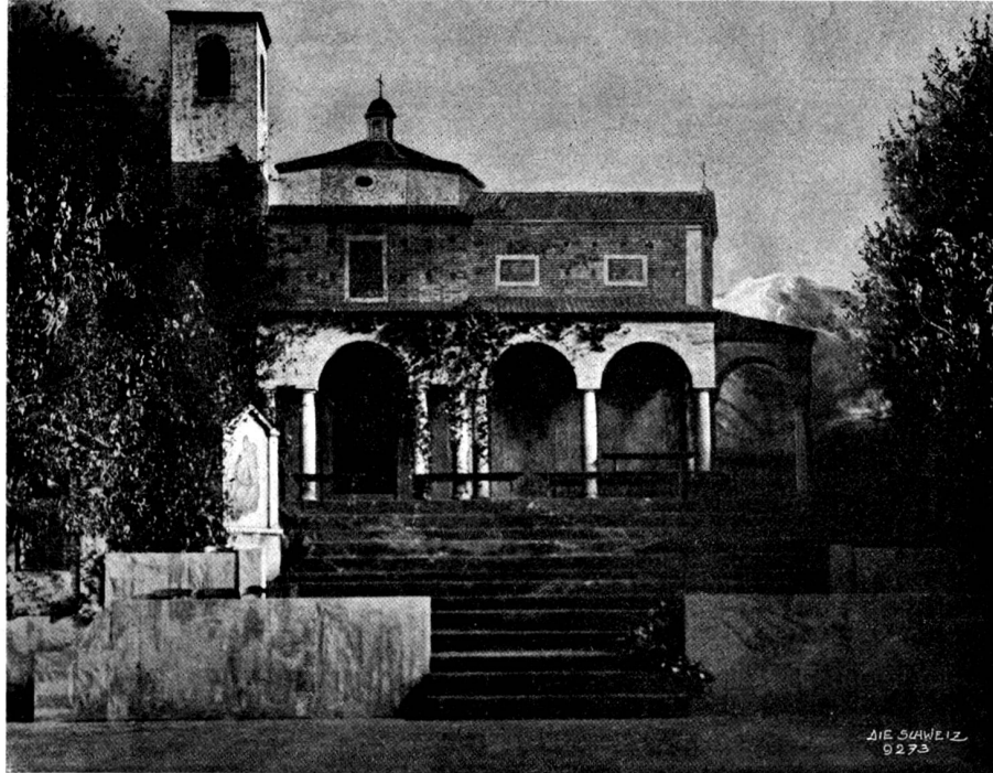
Das Tessinerfest des Lesezirkels Hottingen (in Verbindung mit der Vereinigung „Pro Ticino“, Sektion Zürich). Künstlerische Dekoration: „Wallfahrtskirche im Kastanienhain“.