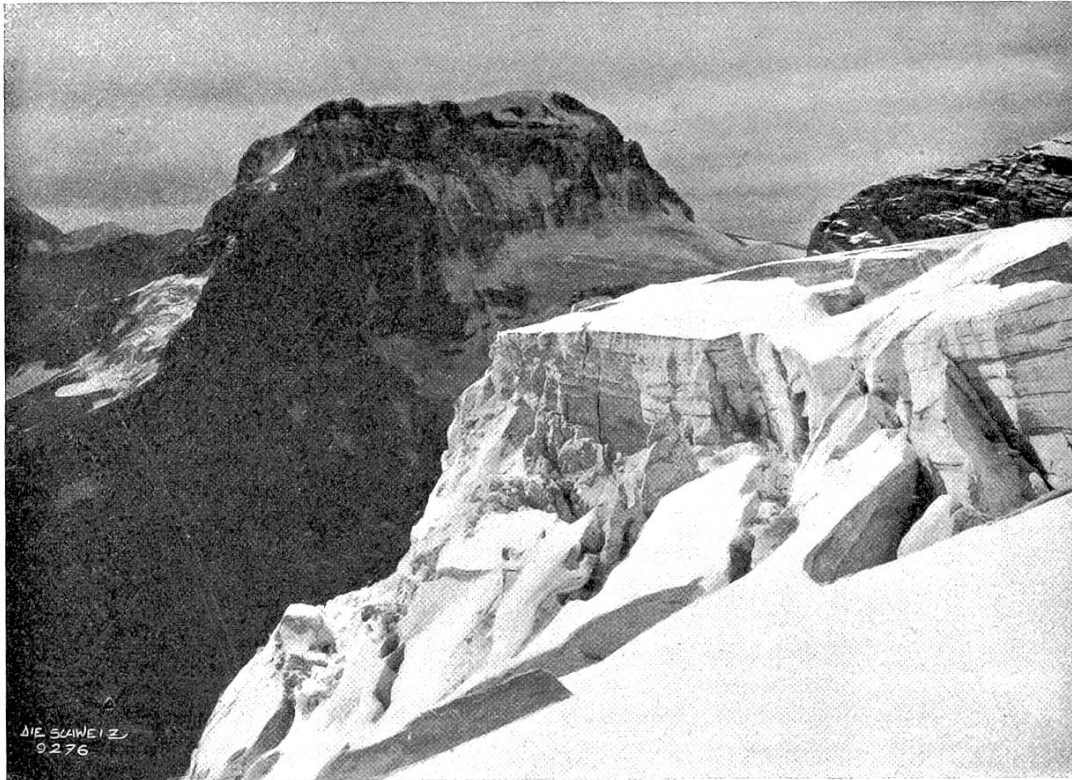
Claridenfirn. Blick auf den Tödi.