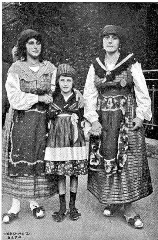
Tessinerfest des Lesezirkels Hottingen: Tessinerinnen in ihren Landestrachten.

Belgien habe sich bei dieser Abstimmung genau an die Vorschriften des Art. 34 des Friedens von Versailles gehalten; auch liegen bei einer Bevölkerung von 63000 Seelen nur 271 Proteste gegen die Angliederung an Belgien vor. Beweise für einen von der belgischen Regierung angeblich auf die Bevölkerung ausgeübten Druck seien nicht erbracht worden. Mit diesem Entscheid des Völkerbundsrats hat sich aber die deutsche Regierung nicht zufrieden gegeben, sondern noch ein offizielles Protestschreiben an den Völkerbunds-