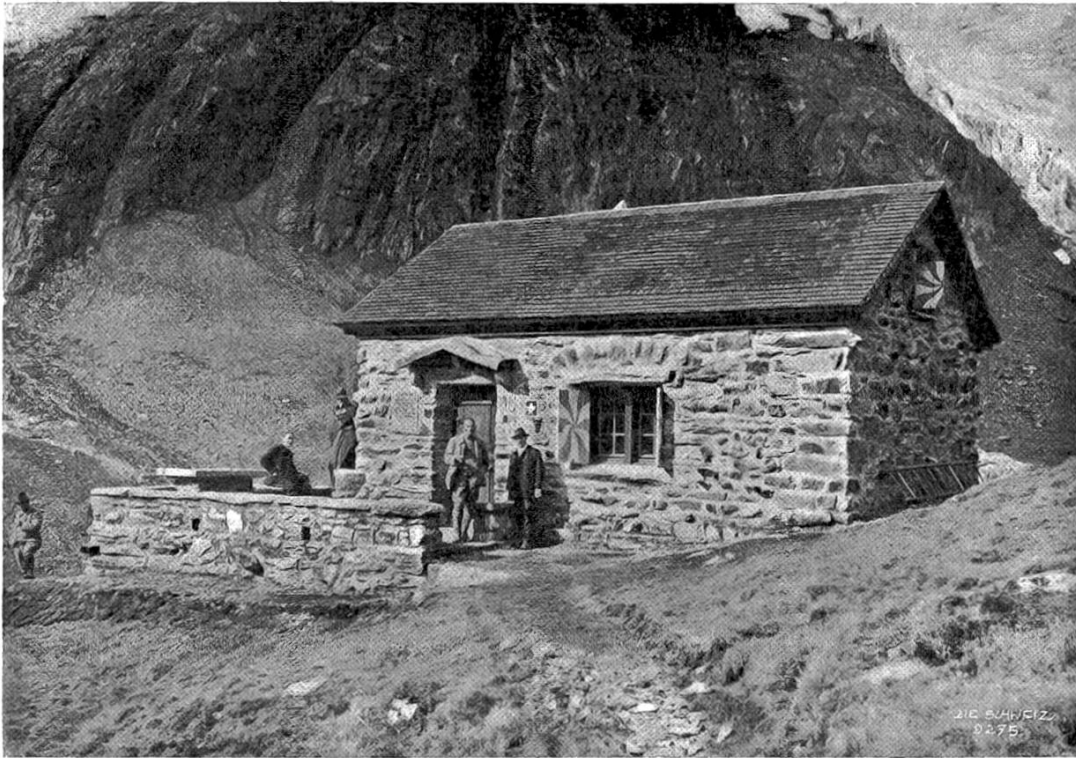
Die neue Voralphütte der Sektion Uto S. A. C. am Wallenbühlhorn, 2170 m ü. M. (eingeweiht 3. Oktober 1920).

Völkerbund aufzunehmen, wenn sie ihm beitreten wollen und imstande sind, die im ersten Artikel der Völkerbundsverfassung niedergelegten greifbaren Garantien zu leisten.“