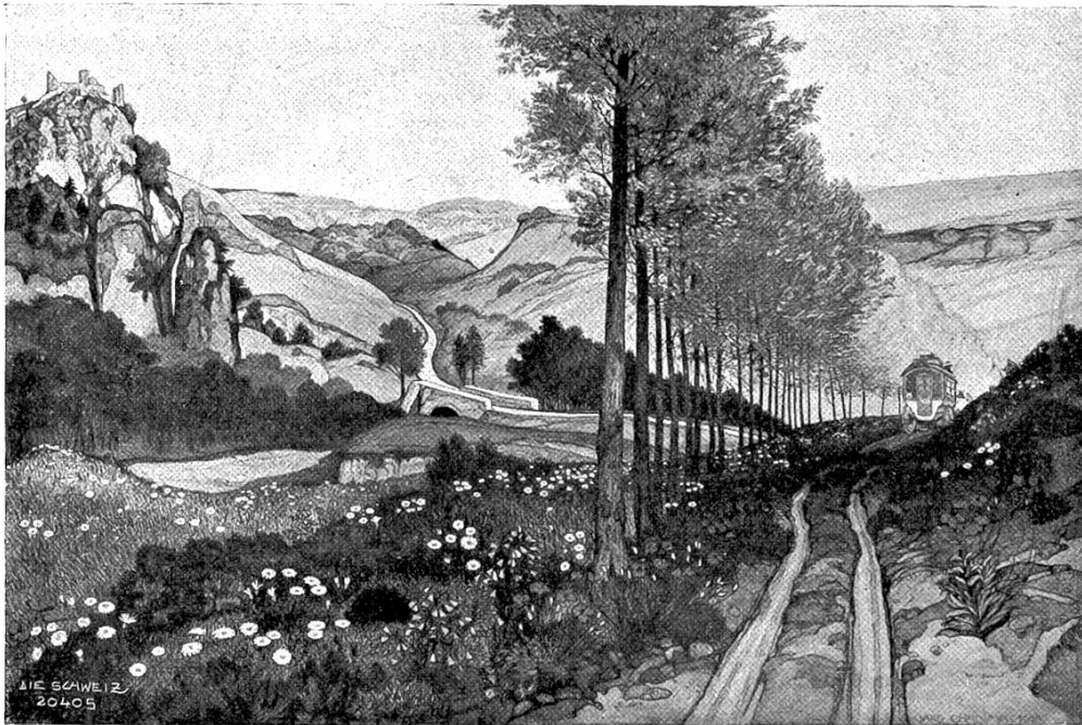
Jaro Chadima, Schwanden (Glarus).