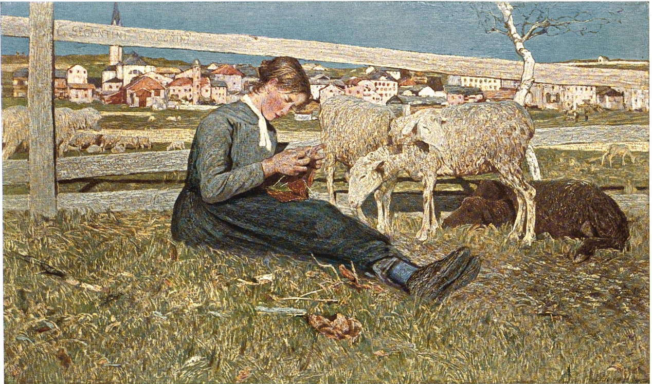
Giovanni Segantini (1858—1899).