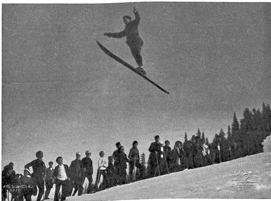
Wintersport in Andermatt: Ein guter Sprung.

Deshalb mag mancher ungläubig gelächelt haben, als in Paris der französische Finanzminister Doumer mit Forderungen hervortrat, welche die Abmachungen von Boulogne und Brüssel nach berühmtem Muster als „chiffon de papier“ behandelten, und Lloyd Georges temperamentvolle Erklärung, er werde bei der Annahme solcher Wiedergutmachungs-Bedingungen sein Bündel Schnüre und heimfahren, hatte wohl die Billigung aller rechtlich Denkenden. Es folgten mühselige Verhandlungen in einer Spezialkommission; Belgien reichte