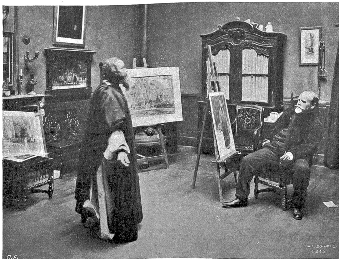
† Eugène Burnand in seinem Atelier beim Skizzieren einer biblischen Figur nach lebendem Modell.

In der Schweiz ereigneten sich zwar keine welthistorisch großen Taten, wohl aber zwei Dinge, die für unser politisches Leben nicht ganz unwichtig sind. Wir verfahren chronologisch und erwähnen zunächst die Urabstimmung über den Beschluß des sozialdemokratischen Parteitagcs in Bern durch die Parteimitglieder. Wenn man allerdings im Parteitagbeschuß eine Niederlage des Leninismus erblicken zu müssen glaubt,