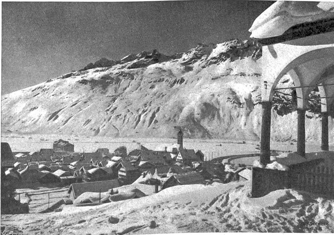
Andermatt im Winter.