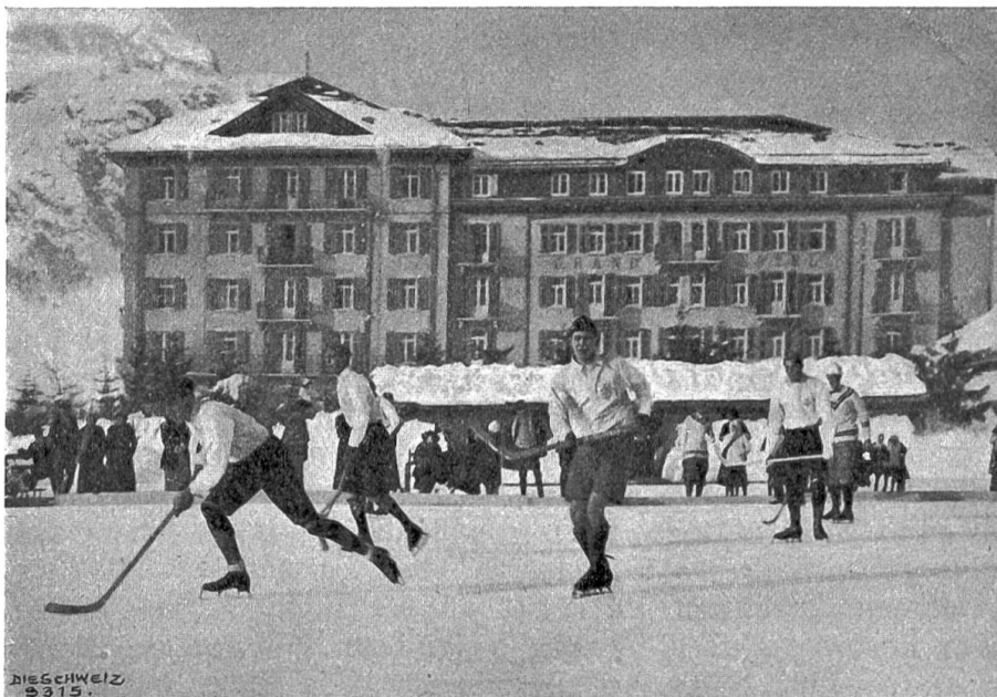
Wintersport in Andermatt: Hockey-Spiel auf der Eisbahn vor dem Hotel Danioth.