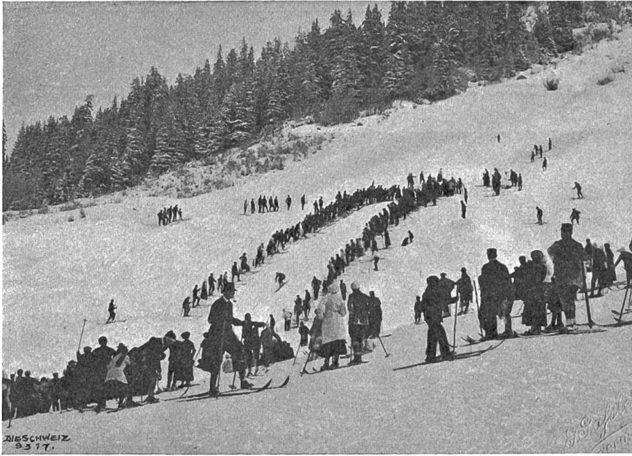
Wintersport in Andermatt: Skirennen an der Gurschensprungchanze.