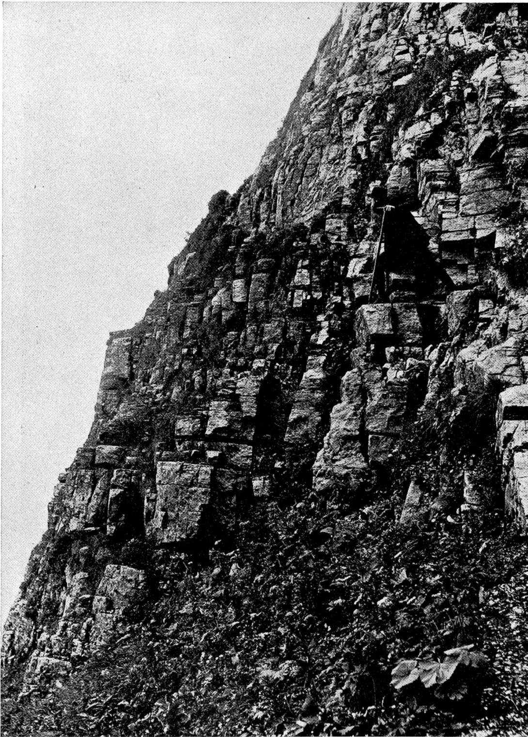
„Bärentritt“ Übergang von Braunwald zur Karrenalp über treppenförmig gestaffelte Hochgebirgsfalk-Schichten