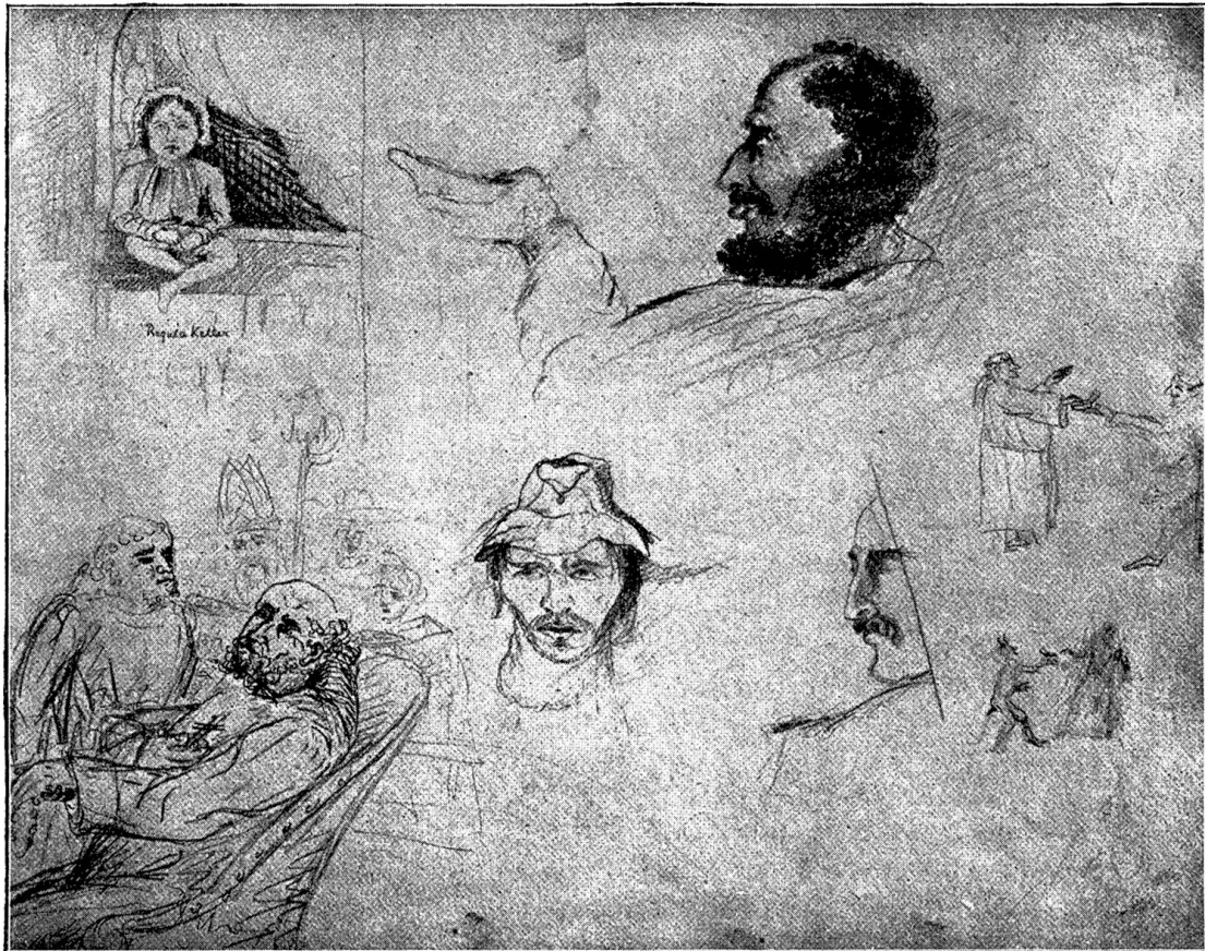
Aus Gottfried Kellers Skizzenbuch: Figürliches

Doch will ich Dir sagen, wie ich sie machen wollte; ich wollte nämlich eine Bande aus dem dreizehnten Säkulum darstellen, alles halbnackte Kerls, fürchterliche Larven, welche einen Räuber aus ihrer Mitte auf eine gräßliche Weise an einen Baum binden, um ihn zu verlassen und den wilden Bestien preiszugeben.“