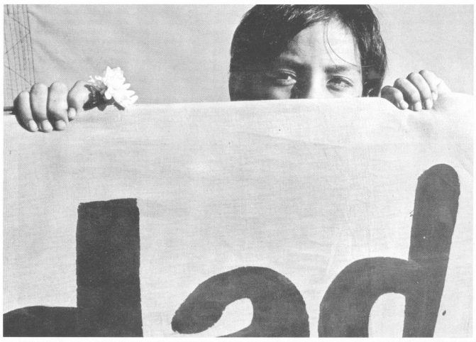
Un llamado a la solidaridad. Ein Aufruf zur Solidarität.