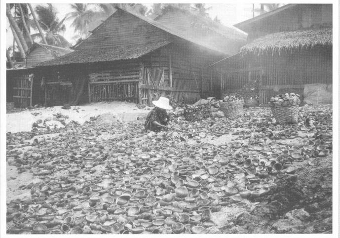
Kauernder mit dem Aufspalten von Kokosnüssen beschäftigt.