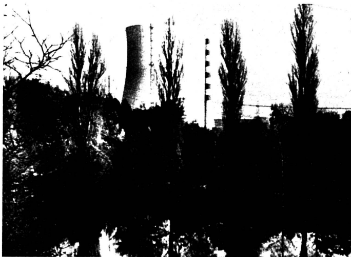
Vu par le Conseil fédéral