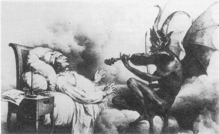
Die heilsame Wirkung von Musik

die der Musik und überhaupt der künstlerischen Tätigkeit darin zukommt, könnte man hier geradezu von einer «Therapiekultur» sprechen. Das Bedürfnis nach «Heilung», die Sehnsucht nach halbwegs intakten Lebenszusammenhängen, entspricht dabei, so ist zu vermuten, dem Ausmass der gesellschaftlichen Entfremdung, dem die Individuen ausgesetzt sind und auf das sie reagieren. Inwieweit diese Suche nach