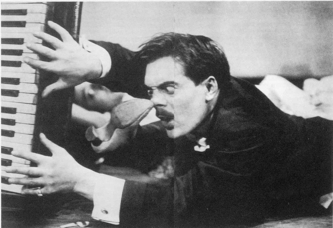
. . . und das andere Ende der Skala: Eindeutig untherapeutische Musik (aus dem Film: Max Comes Across)

«In gewisser Hinsicht kann Bach als eher weiblicher Komponist bezeichnet werden . . . Die männlicheren Aspekte, die Beethoven aufwühlen, liegen ihm