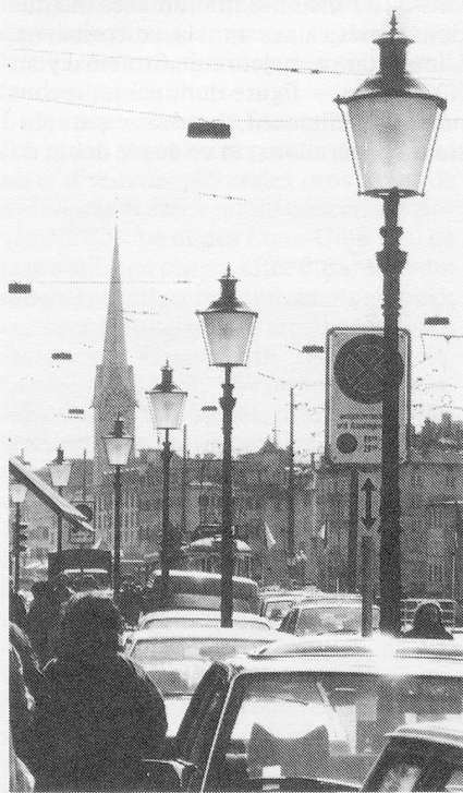
Diese Stadt wird beschallt

Was freilich der «Alltag» «der» «Stadt» genau ist, aus welcher Sicht und Hörweise er anzugehen wäre, ist schwierig zu bestimmen. Wer nachts auf die Stadt zufährt, erkennt von weitem am Himmel ihren Lichtschein; näher kommend und genauer hinhörend, vernimmt er dazu das Surren der Laternen. Denkbar, dass man diesen feinen Lärm in der künstlichen Stille einer mit Gleitbahnen und Computern fast reibungslos ablaufenden Welt später einmal vermischen wird. Wir jedenfalls realisieren ihn kaum bewusst; er ist omnipräsent geworden; tagsüber wird er vom lauten Rauschen des Verkehrs abgelöst. Aus der Ferne ist das ein statistisches Einerlei, ein Echo der Anonymität. Je tiefer man sich in die Stadt hineinbegibt, desto durchhörbarer wird das Rauschen.