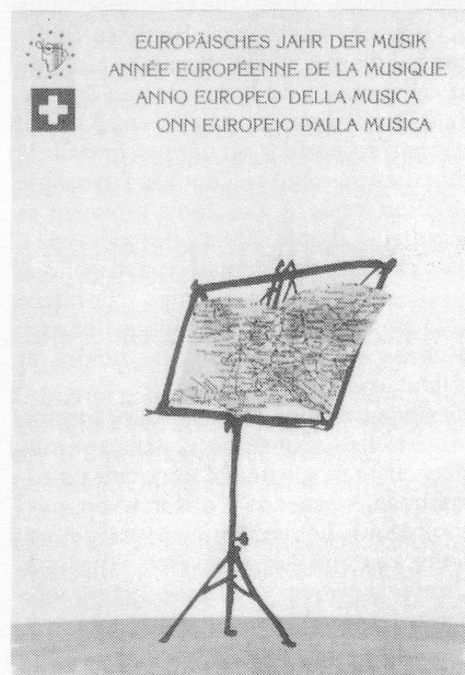
Diese Broschüre informiert über die Schweizer Aktivitäten zum Jahr der Musik

Um überhaupt eine Chance zu haben, mit Geld bedacht zu werden, musste man bis Ende 1983 ein Gesuch einreichen. Doch wer wusste überhaupt, dass da etwas im Tun ist? Der Schweizer Musikrat bzw. das Nationale Komitee unterliessen es nämlich, die Öffentlichkeit zu informieren — ein merkwürdiger Kontrast zum allumfassenden Anspruch des Europäischen Jahres der Musik, das zur Zielsetzung hat, «die Musik aller Sparten und Epochen als Ausdruck eines gemeinsamen kulturellen Erbes an möglichst viele Menschen in Europa heranzutragen». Der Musikrat überliess es den Verbänden, Interessenten zur Geschstellung aufzufordern, und diese taten wenig bis gar nichts. Als Mitglied zweier Verbände erfuhr ich nicht etwa durch diese von der Sache, sondern indirekt durch ein Mitglied des Komitees. Ein Nachblättern im Jahrgang 1983 der «Schweizerischen Musikzeitung» förderte auch keine Information zutage. Es war also einem Kreis von gut informierten Insidern vorbehalten, Projekte einzureichen. Die andern werden erst nach der gross aufgezogenen, mit Bundesratspräsenz beehrten Pressekonferenz davon erfahren haben. Man erwarte deshalb — so Willi Gohl, der neue Präsident des Musikrats — eine Flut von weiteren Eingaben, doch jetzt stünde kaum mehr Geld zur Verfügung. So sympathisch dieses Eingeständnis in seiner Offenheit ist, für die Zuspätgekommenen muss es zynisch wirken, und es muss vermutet werden, dass das Komitee gar nicht interessiert war, eine Flut von Eingaben rechtzeitig zu erhalten.