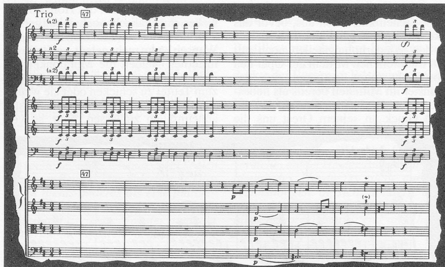
Beispiel 4: Joseph Haydn, Symphonie Nr. 93, 3. Satz (Trio)

zwicktheit dieser Konstruktion irgendwie gespürt hat, rein als musikalischer Erfinder, versteht sich, als listenreicher Fuchs, gebeugt über die Tücken des Materials. Im Trio des Menuetts der Sinfonie Nr. 93 ( Beispiel 4 ) geschieht etwas Überraschendes, wirklich Freches: Die so sorgfältig ausgetüftelte Kunstfolklore bricht in sich zusammen! Ausgerechnet hier, in diesem sonst für zartere Töne reservierten Mittelteil schmetterten Bläsersignale herein, und aus deren Klangschatten tritt noch ein-