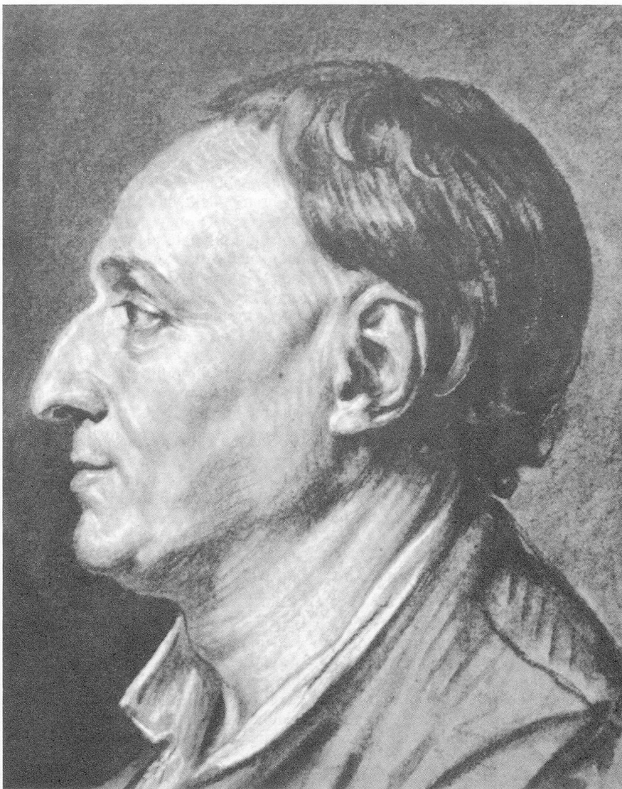
Denis Diderot, Zeichnung von Jean-Baptiste Greuze (vor 1767)

arpeggien hätten ihn ob der Doppelbödigkeit dieser Idylle eines Besseren belehren sollen. In Wahrheit parodiert hier Rameau unbarmherzig die empfindlichste Seite seines eigenen Stils. Gerade durch die scheinbar unverstellte Natürlichkeit dieser Musik lässt Rameau den dargestellten Wahnsinn so beunruhigend nah an sich herankommen, dass sogar Fachleute Ernst und Wahn nicht mehr voneinander unterscheiden können.