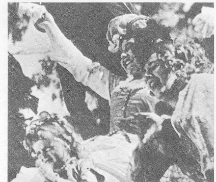
Sterbende Kommunardin und – im Gegenschuss – applaudierende Bourgeoisie

Heute wird der V-Effekt vorschnell Bertolt Brecht als Erfinder zugeschrieben. Dabei waren es die russischen Formalisten, die ihn in der Literatur einführten, und Kosinzew und Trauberg, die ihn erstmals in Theater und Film anwandten. Dazu heisst es in einem Artikel von 1928: «Es handelt sich um eine exzentrische Kombination von Gegenständen, um das Auftauchen eines Gegenstandes ausserhalb seiner natürlichen Umgebung und um die Darstellung von Beziehungen, die er mit einer Umgebung unterhält, die ihm nicht entspricht.» 15 Trauberg und Kosinzew wenden dieses Prinzip als «emotionelle Technik» an: Immer dort, wo eigentlich grosse pathetische Ge-