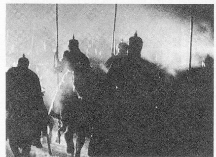
Die deutsche Invasion von Paris

So eindeutig die politische Aussage des Films ist, so doppelbödig sind bei näherer Betrachtung die stilistischen Mittel, mit denen die Klassengegensätze in Szene gesetzt sind. Vor allem die Musik begibt sich dabei kühn aufs Glatteis. Da ich darauf gesondert eingehen werde, hier ein Beispiel beunruhigender optischer Ambivalenz: Die Bürger im Film betätigen sich, wie gesagt, als Voyeurs; dauernd fuchteln sie mit Lorgnetten und Ferngläser herum. Ganz egal, ob Operette, Barrikadenbau oder Kommunar-