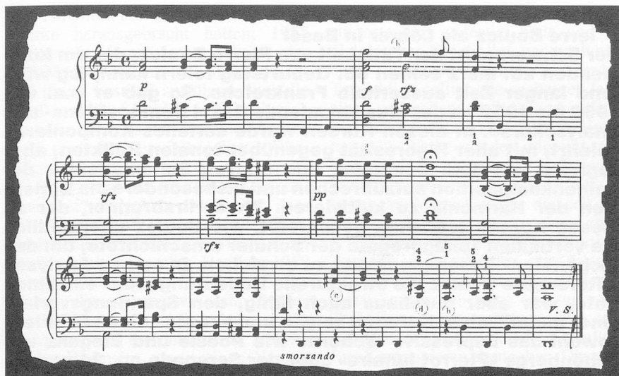
Exemple 3: «Les douleurs de la reine de France» de Jan Ladislav Dussek