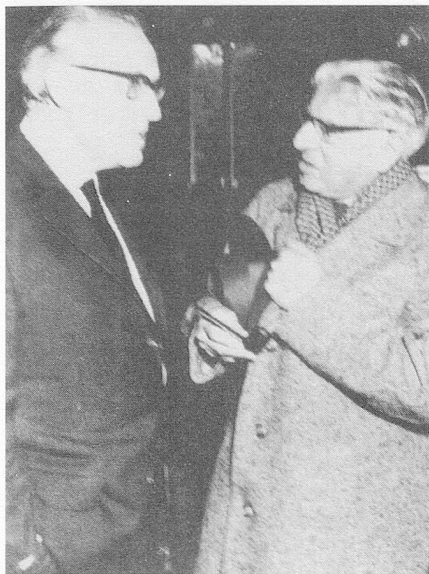
Wieland Wagner und Ernst Bloch 1966

bender Weise transparent. Ihm verdanke ich, Wagner in einem kulturell reichen und philosophisch-historischen Zusammenhang neu entdeckt zu haben. Unter seinem Einfluss emanzipierte ich mich nun auch äusserlich von dem Festspielhügel und meiner Bayreuther Kindheit. So verfasste ich meine Abiturarbeit in Deutsch über Arnold Zweigs «Sergeant Grischa» und später meine Doktorarbeit über «Weill und Brecht». Bloch, dessen Verfremdungs-begriff ich als Zentrum meiner «Weill-Brecht»-Studie nahm, verstand als Einziger sofort die Absicht meiner scheinbar rein «antiwagnerschen» Arbeit über Weill. Meine antisemitische Grossmutter, wie konnte es anders sein, empfand diesen Schritt als Nestbeschmutzung und Verrat des Wagnerschen Erbes, ohne dabei je begriffen zu haben, welchen Schaden sie und ihr Freund Wolf, sprich Adolf Hitler, und ihresgleichen Wagner, sei-