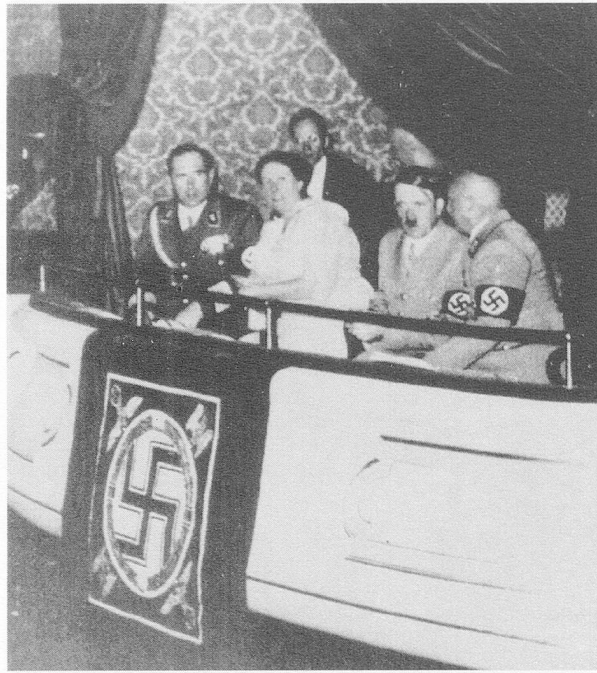
Adolf Hitler mit Winifred Wagner bei der Erstaufführung der «Meistersinger» zum Reichsparteitag 1935 im Nürnberger Opernhaus

H einrich Sutermeister, un «neutre» dans l'Etat nazi