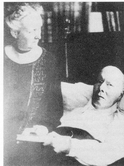
Winifred Wagner und Houston Stewart Chamberlain 1927, kurz vor dessen Tod

Welchen Wagner Hitler, dessen Wagner-Bild sich seit seiner Linzer Rienzi-Jugenderfahrung 1906 nicht mehr verändert hatte, meinte, lässt sich insbesondere einem Zitat aus dessen Gesprächen