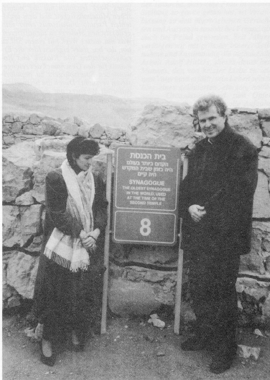
Der Autor und seine Frau vor der Synagoge in Massada

Ich kann heute sagen, dass dieser Dokumentarfilm der Beginn einer inneren Wende auch in meiner Auseinandersetzung mit Wagner wurde. Mit einem Schlag endete das Vertrauen gegenüber