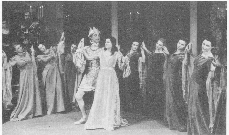
«Romeo und Julia», 1. Akt, 2. Bild, 9. Szene

Eine Interpretation der Musik Morton Feldmans