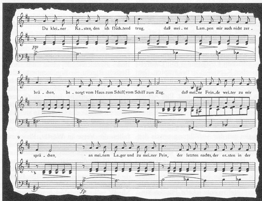
Beginn von «An den kleinen Radioapparat»