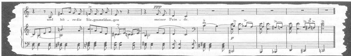
Takt 42 bis Schluss von «Hotelzimmer 1942»