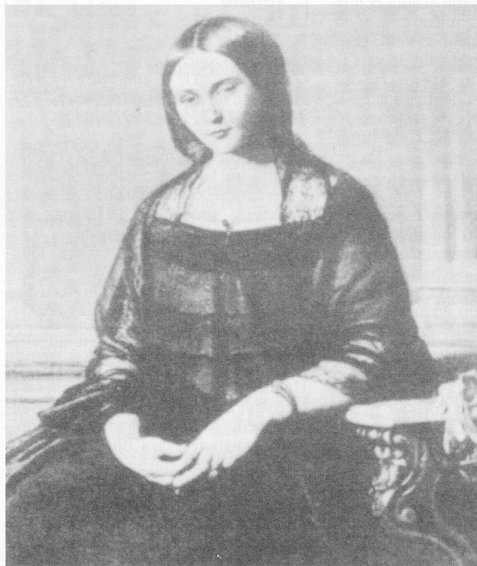
Clara Schumann als Mona Lisa

B: Nur, wenn sie (resp., insofern es die eine meines Wissens nicht gibt: wenn diese oder jene psychoanalytische Me- thode) den Künstlern unter den «Klien- ten» die Befähigung zum, beispielswei- se, Komponieren – die ja, jedenfalls angesichts einer «Edelnormalität», eine Abweichung, ein «Defekt» ist – weg- heilen will.