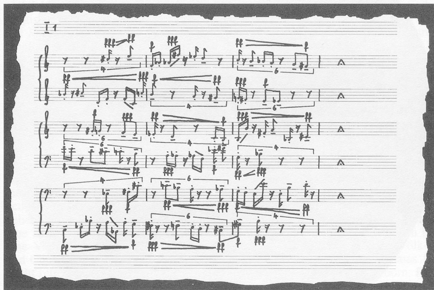
«Die schöne Frau von Thun», 1 von 36 Seiten