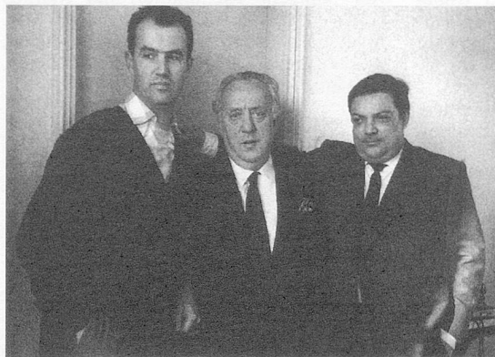
Luigi Nono, Karl Amadeus Hartmann, Bruno Maderna (Dezember 1961)

verdächtigen Anzahl von Anmerkungen. Selbst Kurven, welche die Aufführungszahlen der verschiedenen Genres darstellen, hat er erstellt. Kurve 7 ist zu entnehmen, dass sich das Total der Wiedergaben repräsentativer grossformatiger Werke seit Anfang der