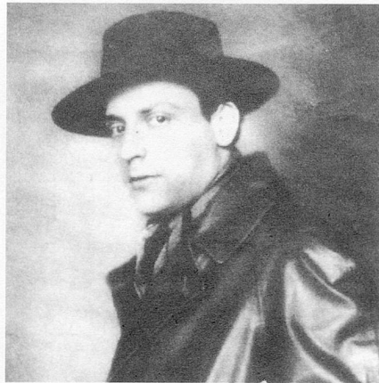
Paul Dessau in den 20er Jahren