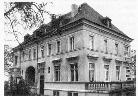
Dresdner Zentrum für zeitgenössische Musik

Selbstgemachte Jubiläumsgaben wie diese Festschrift zum zehnjährigen Bestehen des Dresdner Zentrums für zeitgenössische Musik haben primär musikpolitische Funktion: Man will der Öffentlichkeit – und speziell den Geldgebern – beweisen, was man geleistet hat, die Unerlässlichkeit eigenen Tuns