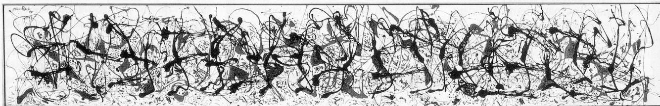
Jackson Pollock : Summertime (1948 – Tate Gallery)

Divergences, oui, mais il y en avait toujours eu, comme je l'ai dit déjà dit. Ce qui est extraordinaire, c'est que ça ne changeait rien à la chaleur de nos rapports. Nous ne terminions pas nos conversations musicales en colère.