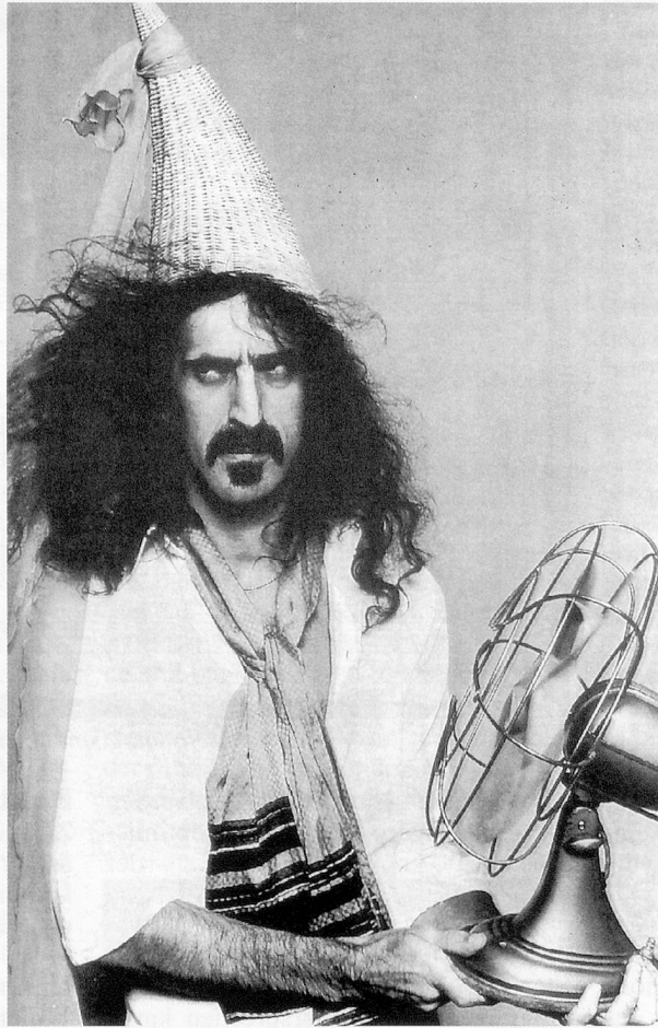
Frank Zappa in den 70er Jahren

die Drogenszene der End-60er in San Francisco ein grossangelegtes Testprogramm der Regierung gewesen sei, sondern der gesamte Drogenmarkt «Teil der Strategie, mit der die Regierung uns alle unter Kontrolle hält», – mit solchen Ideen führt Zappa Politik zurück auf klandestine Machenschaften einer Machtclique, die sich aus Vertretern krimineller Organisationen von der Mafia über die Gewerkschaften bis zu Kirche und Staat rekrutiert. Mit Hilfe verschiedener Regierungs-