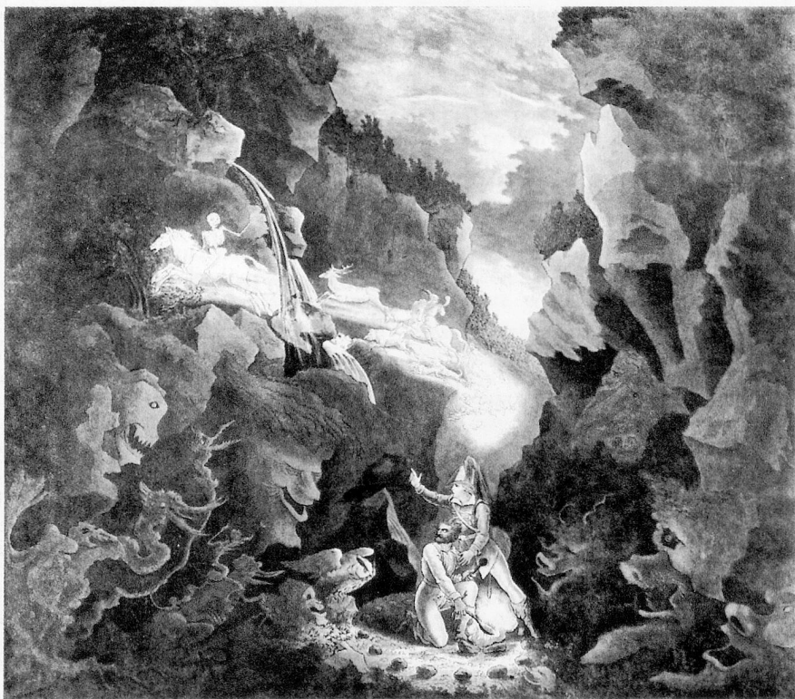
Carl Wilhelm Holdermann: Die Wolfsschlucht für «Der Freischütz» (Weimar 1822)

concret. Aux Editions du Seuil paraissent « à l'identique » ce monument, alors à bien des égards prophétique, qu'est le Traité des objets musicaux (Paris 1998, 712 p.), ainsi que le journal des premières expériences, A la recherche de la musique concrète (Paris 1998, 230 p.). Parce que sans aucun doute, comme le burinait