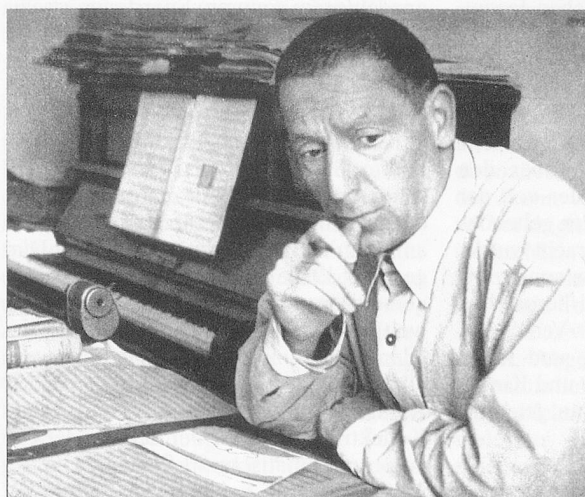
Paul Dessau bei der Arbeit am «Lukullus» (1949)