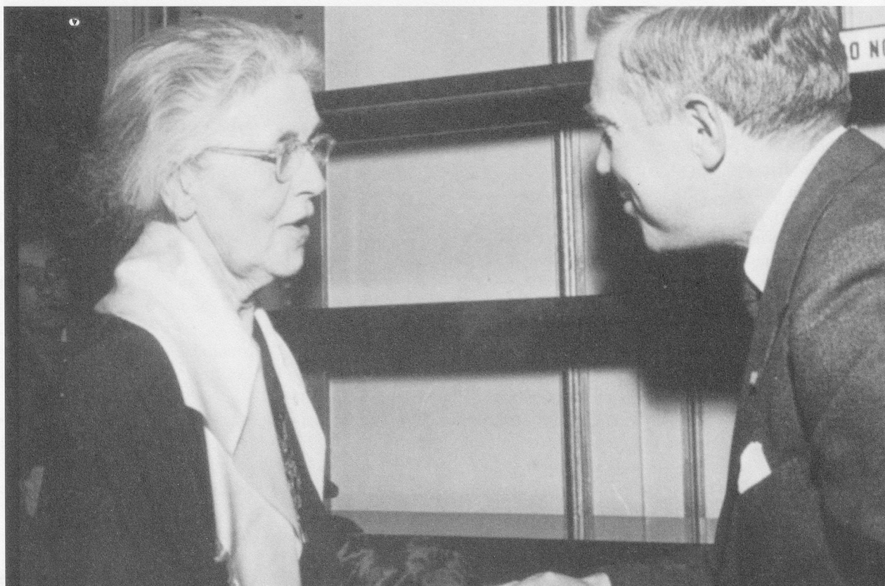
Mit Nadia Boulanger, Paris 1954