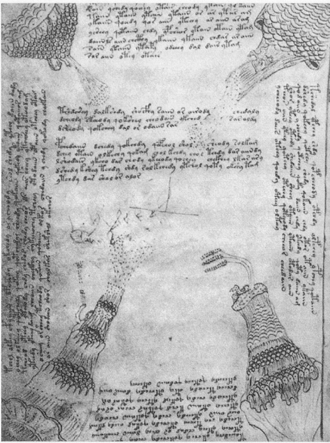
Voynich Cipher Manuscript (Ausschnitt)

Die auf dieser CD eingespielten Werke des 1960 geborenen Hanspeter Kyburz, die den «Beginn seines »eigentlichen« Komponierens» markieren (J. P. Hiekel), sind in allen Belangen die pure Antithese zu den harmlosen Stücken der kleinmeisterlichen «Groupe Lacroix», nämlich komplex, farbig, rhythmisch und instrumental raffiniert gesetzt, suggestiv, vielschichtig und -deutig, verrätst, offen, unvorhersehbar, irritierend. Das dürfte vor allem für diejenigen überraschend sein, welche die Gelegenheit hatten, die brillant vorgetragenen und mit Graphiken verdeutlichten Ausführungen Kyburz' über seine computergestützte Arbeit mit Algorithmen als Basis seines Kompo-