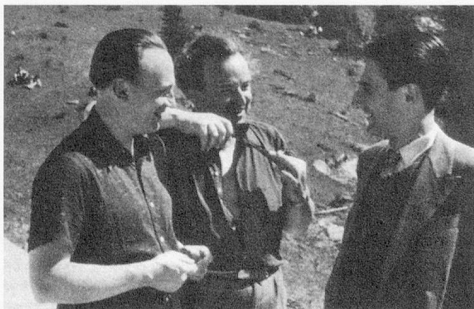
Paul Sacher, Arthur Honegger und Dinu Lipatti

Mehr als vierzig Jahre nach seinem Tod bleibt die Situation Arthur Honeggers unbequem: Einerseits fehlt seiner Musik die populistische und chauvinistische Ader der «Six», mit denen sie in Verbindung gebracht wird; andererseits bleibt sie innerhalb eines verhältnismässig konventionellen Stil- und Formrahmens, innerhalb von Konventionen, die nicht wie beim besseren Schostakowitsch eine Maske darstellen, sondern einen Glaubensakt, den Ausdruck einer idealen Gemeinschaft. Die subjektiven Gewaltstrieche seiner Musik in einigen Passagen der ersten Sinfonie und im ersten Satz der Liturgischen beispielsweise zerreißen den Schleier kaum und überschreiten nie die