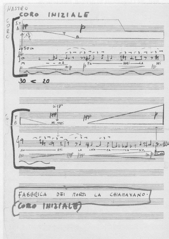
Autographe Partiturseite aus «La Fabbrica illuminata»