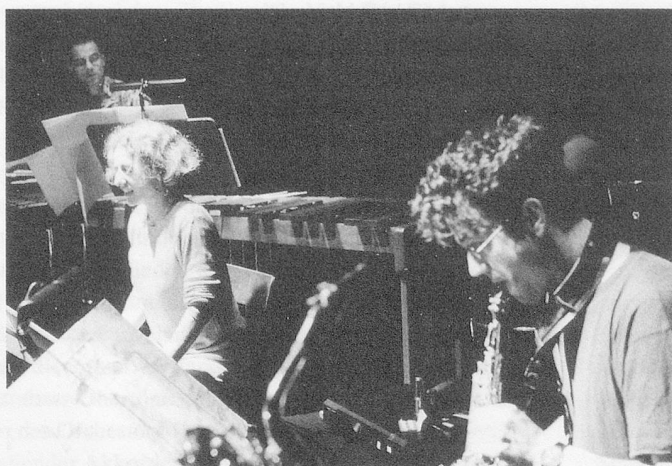
«Girafe bleue» bei der Probe für den Auftritt am Tonkünstlerfest

«Sprachmusik» am 99. Tonkünstlerfest in Baden und Wettingen (27.–30. Mai)