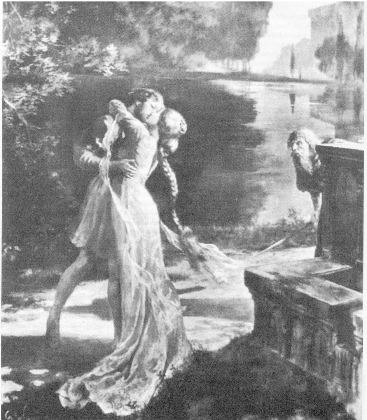
Plakat für «Pelléas et Mélisande», 1902 (Ausschnitt)

Ziel zu kommen und fallen sich unablässig gegenseitig ins Wort. In anderen Stücken wie Et la lune descend sur le temple qui fut , Brouillards oder Étude pour les cinq doigts führen die Vermeidung von Entwicklung und Lyrismus sowie die zeitlichen oder räumlichen melodisch-harmonischen Brüche zum Eindruck einer Collage kleiner Taktgruppen (bisweilen von nur einem oder zwei Takten Umfang). «Diese Diskontinuität des Diskurses, der Rhetorisches verwirft und Gefühlsausbrüchen misstraut» 21 , wird zu einer eigentlichen Kompositionstechnik, vergleichbar mit dem offensichtlich sinnlosen Gegenüberstellen der Szenen in Maeterlincks Hôpital (Serres Chaudes) oder der Antworten in Les Aveugles , vergleichbar auch mit dem Verfahren der Kubisten, verschiedene Blickwinkel eines einzelnen Objektes aufeinanderprallen zu lassen, vergleichbar schliesslich mit dem Gebrauch der Collagetechnik.