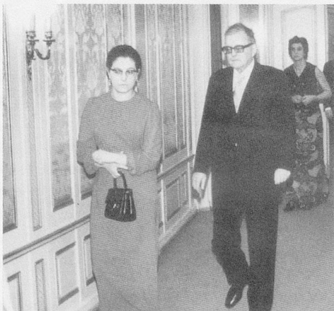
Schostakowitsch in der Deutschen Staatsoper Berlin anlässlich der Aufführung der «Nase», 1972

Mit seiner ersten Oper Die Nase , die der 22-jährige Dimitri Schostakowitsch 1928 vollendete,