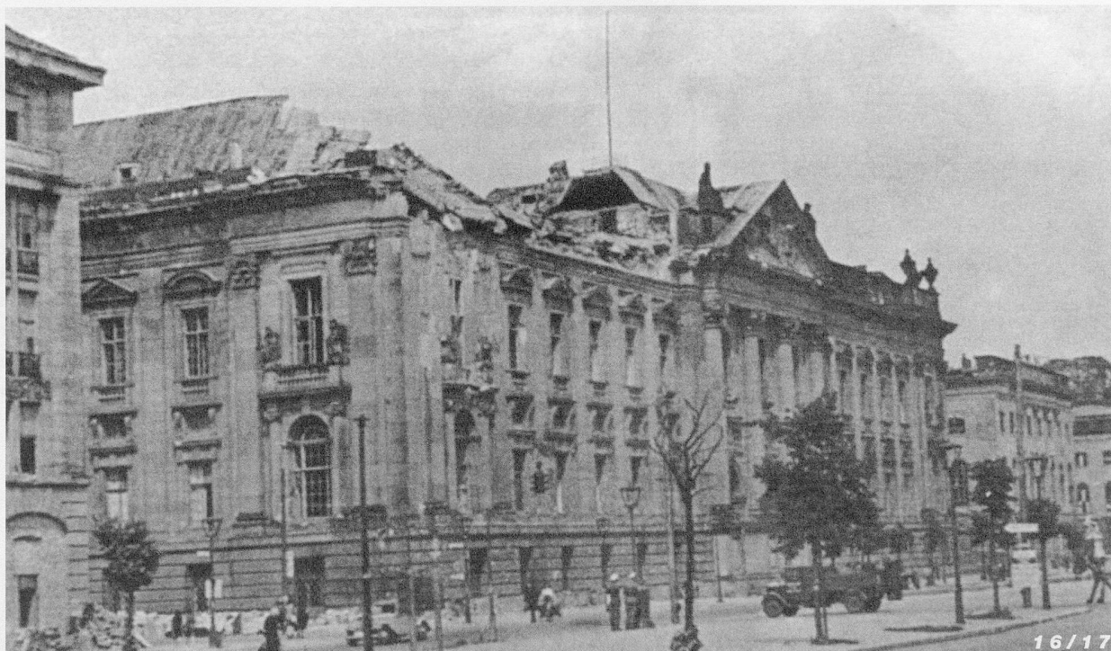
Prise de vue 1945