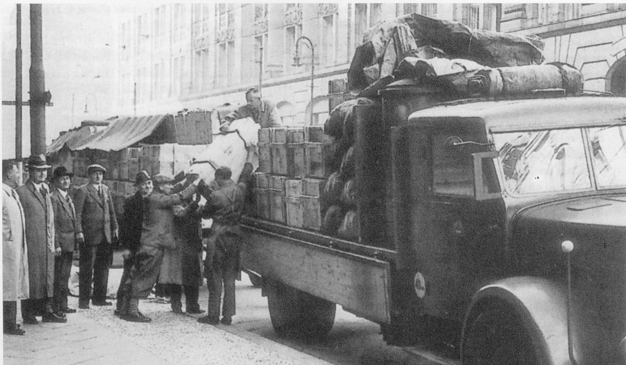
Chargement des caisses de livres devant la Bibliothèque nationale, Berlin 1941