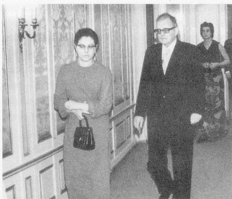
Schostakowitsch à l'Opéra d'Etat de Berlin lors de la représentation du «Nez» en 1972

Dans son premier opéra, Le nez , achevé en 1928 à 22 ans, Dimitri Chostakovitch porte à la scène